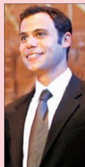
محمد عادل إمام