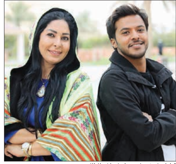
الطرارة ونور في مسلسل «آخر المطاف»

موضحا أنه في «آخر المطاف» يجسد شخصية «عثمان» الشاب العاق بوادته بسبب رفضها زواجه من ابنة عمه بسبب وجود خلافات أسرية سابقة تجمع الأسرتين لكنه يصبر على الزواج منها ليكتشف فيما بعد أنها تزوجت منه بقصد الانتقام من أفراد أسرته.