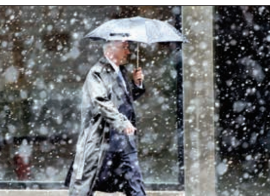
أميركي يقني نفسه بمظلة

واشنطن - أ.ف.ب: ضربت موجة برد قد تكون أسوأ عاصفة يشهدها الساحل الشرقي للولايات المتحدة هذا الشتاء، نصف البلاد الإثنين وأدت الى إلغاء مئات الرحلات الجوية. وبعد شتاء معتدل بشكل غير معتاد وعلى الرغم من اقتراب فصل الربيع، غطت العاصفة سكتيلا بالثلوج منطقة واسعة تمتد من وسط سلسلة جبال الابالاش الى منطقة نيو انغلند. وحذرت أجهزة الارصاد الجوية من أن العاصفة ستبليا يمكن ان تسبب هبوطا قياسيا في درجات الحرارة مساء الإثنين والثلاثاء، وكذلك عاصفة ثلجية تؤدي الى خلل في الرحلات وانقطاعات في التيار الكهربائي. وأصدرت الارصاد الجوية تحذيرا من عواصف ثلجية في نيويورك بينما يجعل الضباب السفر برا «بالغ الخطورة»، ويفترض أن تصل العاصفة الى واشنطن أيضا. وقالت الارصاد الجوية انها تتوقع «تساقط كميات كبيرة من الثلوج مما سيجعل السفر خطيرا. لا تسافروا الا في حال الطوارئ واحتفظوا بمصابيح وبمواد غذائية ومياه في سياراتكم»، وألغيت مئات الرحلات تحسبا للعاصفة. كما يقول موقع «فلايت-اوير» الذي يحصي كل تأخير او إلغاء لرحلات.