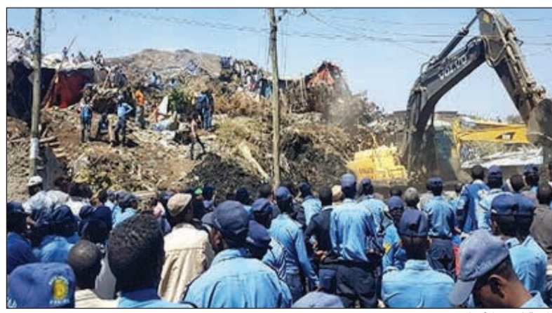
رافعة لرفع الانقاض

6 جرافات عن ناجين وجثث في المكب الذي يستقبل منذ نصف قرن قسما كبيرا من نفايات أديس أبابا، البالغ سكانها 4 ملايين. وهذه ليست أول كارثة رئيسية في المنطقة تغير شكلها بانفصال قسمها الأكبر عنها وانهارها حاملا معه مواد بناء، فحرق وقتلت 208 فلبينيين وجرح 100 آخرين بالعاصمة مانيلا.