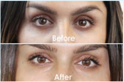
أفضل علاج للهالات السوداء هو حقن الفيلر

ويعالج الدكتور حب الشباب والبشرة الدهنية والكلف ويعمل على نضارة البشرة باستخدام تقنية «ديرمابن» وكذلك تحت الجسم البارد وعلاج السيلوليت بالفلاشيب ويعالج مشاكل الشعر بالبلازما والميزوثيرابي ويعالج الدوالي بالتصليب.