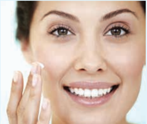
ضرورة وضع المرطب يوميا بعد الحمام للحفاظ على ترطيب البشرة