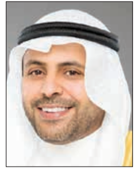
وزير الأوقاف محمد الجبري

أعلن وزير الأوقاف والشؤون الإسلامية ووزير الدولة لشؤون البلدية محمد الجبري أن وزارة الأوقاف والشؤون الإسلامية برعاية سامية من صاحب السمو الأمير الشيخ صباح الأحمد، تقيم جائزة الكويت الدولية لحفظ القرآن الكريم وقراءته وتجويد تلاوته الثامنة في الثاني عشر من شهر إبريل المقبل. وقال الجبري في تصريح صحافي أن هذه الرعاية السامية من صاحب السمو الأمير، خير دليل على حرص