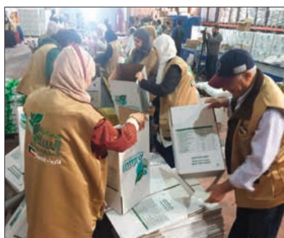
تجهيز وتعبئة الطرود لتوزيعها

والبطانية 4 دنائير، مبدياً استعداد الجمعية لتوزيع المساعدات بشكل فوري حال تسلم التبرع، وبين أن الجمعية ستقوم بتوزيع شاحنات كبيرة مليئة بالمواد الإغاثية، وهي تحوي كميات معتبرة من المواد الإغاثية سواء كانت مواد غذائية وملبوسات وكسوة وخياماً وبطانيات ومواد تدفئة، كما قامت الجمعية بتأجير مكاتب بالاطفال والمحتوية على حليب خاص لهم وبطانيات بمقاسات مختلفة لزوم واحتياجات أطفال المخيم، وستشمل عملية التوزيع عمليات توزيع