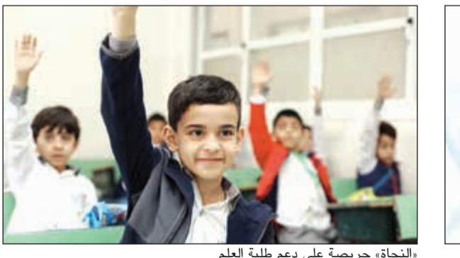
«النجاة» حريصة على دعم طلبة العلم