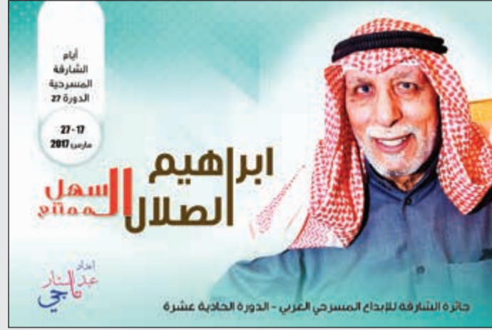
غلاف كتاب «إبراهيم الصلال.. السهل المتنع»

المسرحية أوائل خمسينيات القرن الماضي حين شارك بالتمثيل في مسرحية مدرسية تحت عنوان «حرب البسوس»، ولكن بدايته في مسرح المحترفين كانت مع مسرحية «سكانه مرته» وهي أول مسرحية لفرقة المسرح الشعبي وقدمت عام 1964م من تأليف حسين الصالح، وأعدّها حواراً وأخرجها عبدالرحمن الضويحي، وقد استمر عرضها لنحو شهر. من سنة 1965 وصولاً إلى 2006، شارك الصلال في العشرات من العروض المسرحية الجماهيرية والنخبوية بصحبة أجيال عدة في المسرح الكويتي