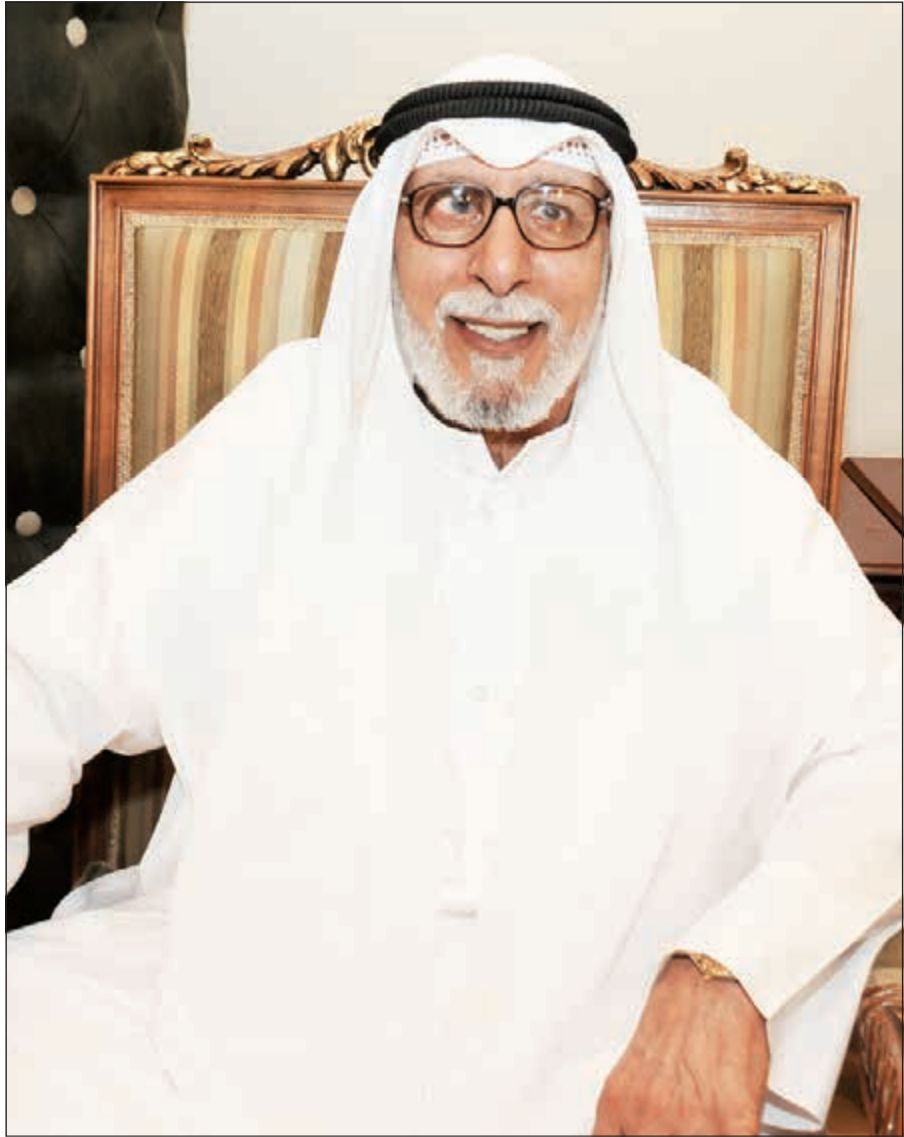
الفنان القدير إبراهيم الصلال