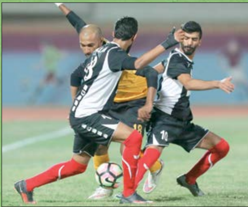
القادسية يسعى لتجاوز خيطان