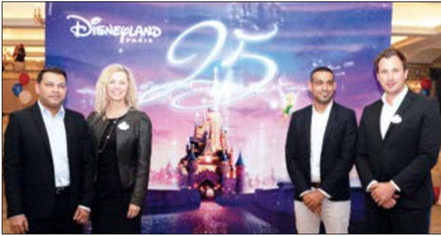
لقطة تذكارية خلال الحفل

جديدة، كما أن الحجز ميكراً يساعد على تجنب ضياع الفرص نتيجة الطلب الهائل». وفي 2017، تكون الذكرى الـ 25 لديزني لاند باريس حيث تكون هناك مجموعة من العروض والفعاليات الجديدة التي تحدث خلال هذا العام، ففي 17 يونيو وفي مسار جديد لمدة 11 ليلة تمت زيارة أوروبا وبربادوس ومارتينيك وسانت كيتس وتورتولا وجزيرة ديزني الخاصة، كاستاواي كاي، وفي 28 يونيو، مسار أوروبا وكورواكا وسانت كيتس وتورتولا وكاستاواي كاي. ديزني الخاصة في جزر البهاما، ويتم تصنيفها بأنها الأكثر دعوة من قبل ضيوف ديزني كروز لاين، وإعطاء الضيوف الوقت في هذه الجزيرة التي تمثل قطعة من الجنة، تم اختيار رحلات ألام ديزني البحرية من ميناء كانايفرات لتتوقف مرتين في كاستاواي كاي.