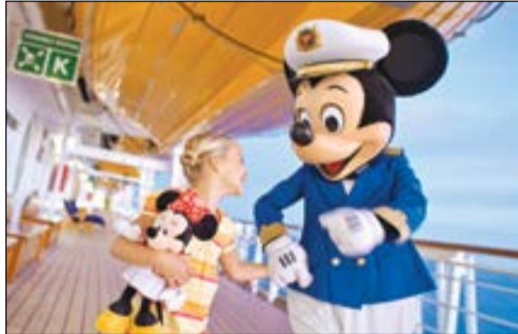
ديزني... عالم رائع

بالتعاون مع وفد ديزني لاند - باريس قامت جامبو للسفحة والسفر - الكويت بتنظيم وتقديم عرض مميز لأحدث إطلاقات ديزني من عروض ومنتجات ترفيهية وذلك في شيراتون الكويت يوم 6 الجاري، وحضر العرض عدد من وكلاء السفر وممثلي وسائل الإعلام. إنبا التكري 25 على افتتاح ديزني لاند باريس، وللاحتفال بهذا الحدث الخاص، يتطلع ميكي والأصدقاء إلى أن يصبحوا مستكشفي المستقبل في العرض الجديد للعلامة التجارية الاستثنائية، فهمتهم إبهار الضيوف. وللحدث عن الاستكشاف، فإن المجرة البعيدة، البعيدة للغاية، أصبحت أخيراً في متناول أيدينا من خلال جولات حرب النجوم الجديدة: تستمر المغامرات وجبل الفضاء الضخم لحروب النجوم: بعثة المتريدين، حيث يضمن لك ذلك الشعور بتجربة غامرة، وتستمر الاحتفالات بعرضين نهاريين بالقرب من قلعة الجميلة النائمة، وفي عرض ليلى أخير مذهب، تقدم ديزني بارك إضاءات ديزني الجديدة كلياً، التي تعبر عن ثقافتها الجديدة كلياً.