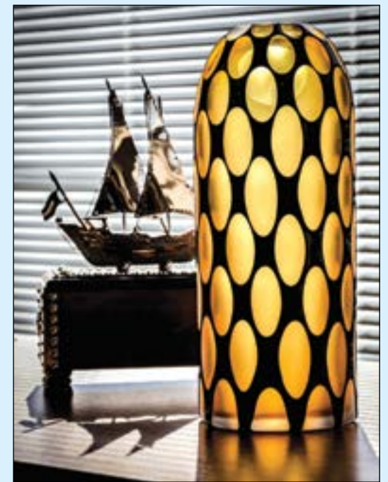
التصميم الذي حصل على المركز الأول