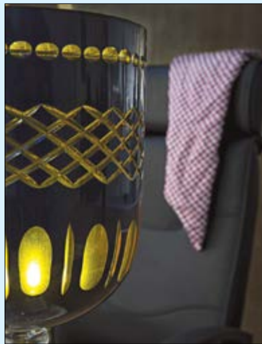
التصميم الذي حصل على المركز الثاني