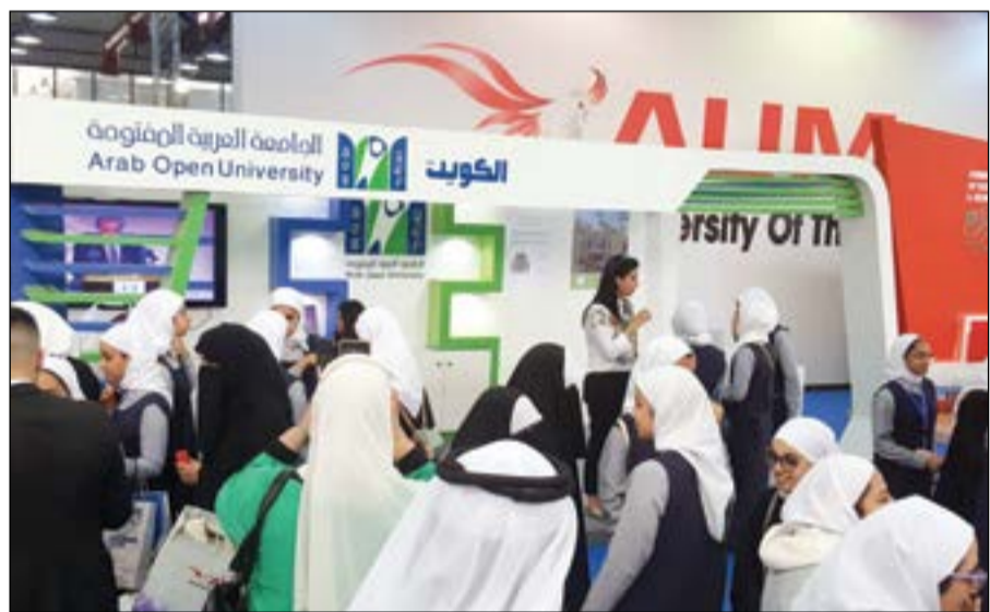
جناح الجامعة في المعرض

المعرفة ونشرها وبناء الخبرات وفقا لمعايير الجودة العالمية دون عوائق زمنية أو مكانية وللإسهام في إعداد القوى البشرية التي تتطلبها التنمية المستدامة في بلدنا الكويت والبلدان العربية، فالجامعة اليوم تقدم التعليم الدمج الذي يعتبر نوعا فرديا من التعليم عبر شراكتها مع الجامعة المفتوحة في المملكة المتحدة من خلال فروعها المتسعة الموجودة في عدد من الدول العربية ومنها في الكويت.