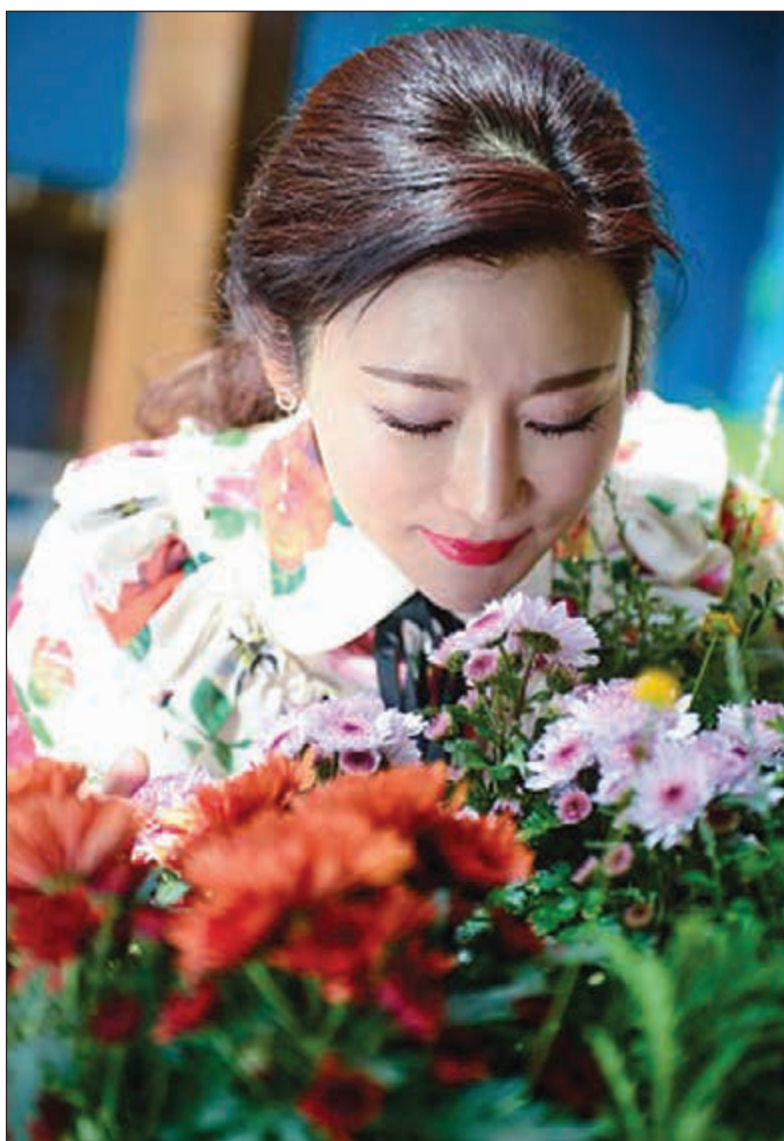
شو مين وسر جمالها

و فجأة تغير الوضع، حيث تعالي الاهتمام بالمرأة حيث تشكل لي انتصارا على الوقت، لكني كنت لا ازال أشعر كما لو ان المجتمع ركلني وراءه..»