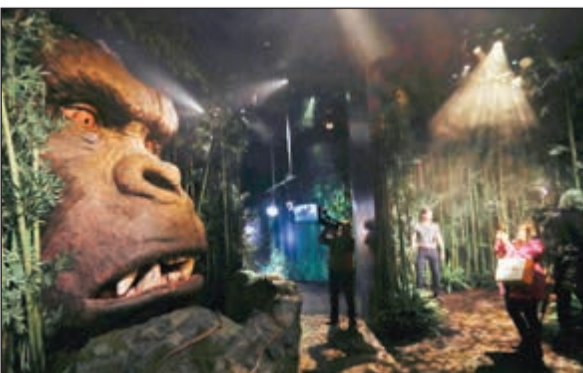
كينج كونج في متحف مدام توسو