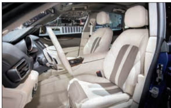
مقصورة داخلية من توقيع إرمينجيدو زينيا

لمازيراتي بهدف إضافة لمسات فاخرة التعميم بلون البيج. وتم استخدام الجلود الفاخرة وعالية الجودة باللون البيج أيضاً في المقاعد الأمامية والخلفية. ويهدف استخدام الخيوط الحريرية ذات التفاصيل المنمنمة والمحبوكة إلى إثراء شكل الألواح للأبواب، فيما تم اختيار حرير بنمط الجيرسي لبطانة سقف السيارة وحاجب أشعة الشمس. كما يوجد شعار «إرمينجيدو زينيا» ليعكس فخامة المزيج المتنوع من المواد المستخدمة في المقصورة الداخلية، خاصة أنها تتألق مع تفاصيل القطع الجلدية الفاخرة باللون الأسود والتي تغطي كامل الجزء العلوي للوحة القيادة والفرش المحيط بالمقصورة بلون البيج. ونسأهم المقصورة الداخلية الجديدة بلون البيج في إثراء الخيارات الفاخرة المتاحة من الحرير بلون الرمادي مع استخدام الجلود الفاخرة باللون الأسود والأحمر والطبيعي. كما سيشهد جناح مازيراتي في معرض جنيف الدولي للسيارات استعراض المجموعة الكاملة من طرازاتها، بما فيها جيبلي وكواترو بورتية بنسخ جران سبورت وجران لوسو من فئة الصالون، وأيضاً سيارة ليقانتى S.