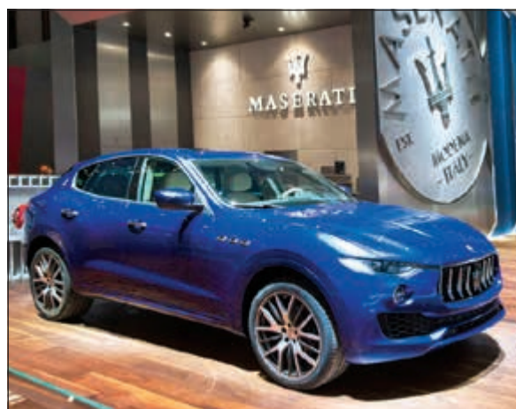
مازيراتي ليقانتى بإصدارها الخاص

المعرض يشهد تقديم «ليقانتى» بمقصورة داخلية حريرية 100٪