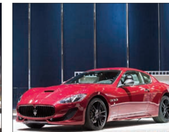
جران توريزمو سبورت