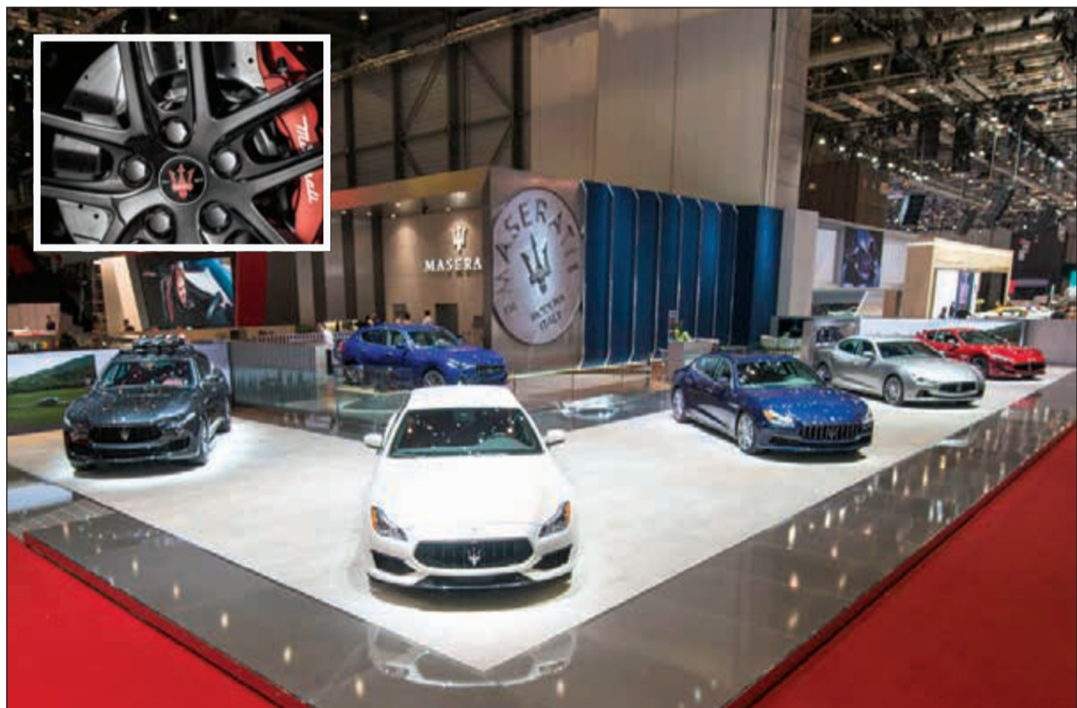
منصة عرض مازيراتي في معرض جنيف للسيارات

على إنتاج عدد محدود منها يبلغ 400 سيارة فقط. كما سيشهد معرض جنيف الدولي للسيارات 2017 تقديم سيارة ليقانتى التي تتسم بمقصورة داخلية حريرية 100٪ من صنع إرمينجيدو زينيا. صممت دار إرمينجيدو زينيا حريس جديد وخاص