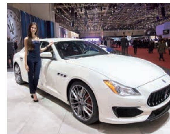
كواترو بورتية جران سبورت