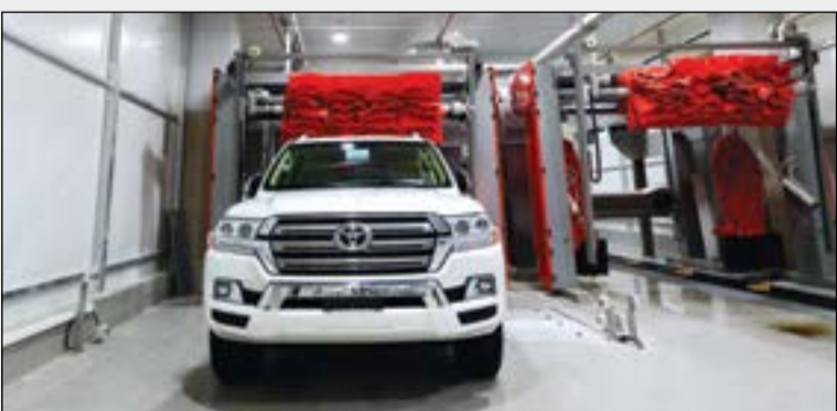
ركن غسيل السيارات