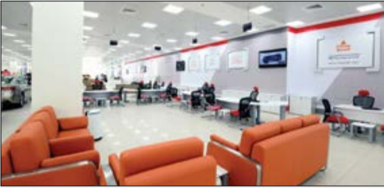
قاعة للضيافة واستقبال العملاء