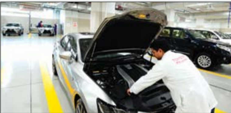
قسم مراقبة الجودة