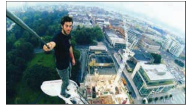
المغامر الذي اعتلى أحد أبراج المارينا لالتقاط «سيلفي».

للمرة الثانية وخلال أيام.. «سيلفي» قاتل جديد في دبي!