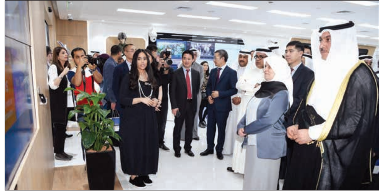
جولة في مركز تدريب هواوي

تعزيز التعاون بين الجانبين في قطاعي الاتصالات وتكنولوجيا المعلومات