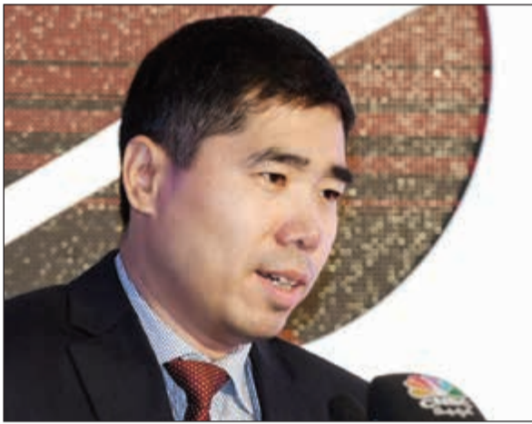
السفير الصيني وانغ دي ملقيا كلمته