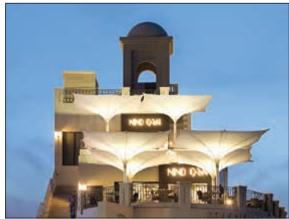
أحد مطاعم المجموعة