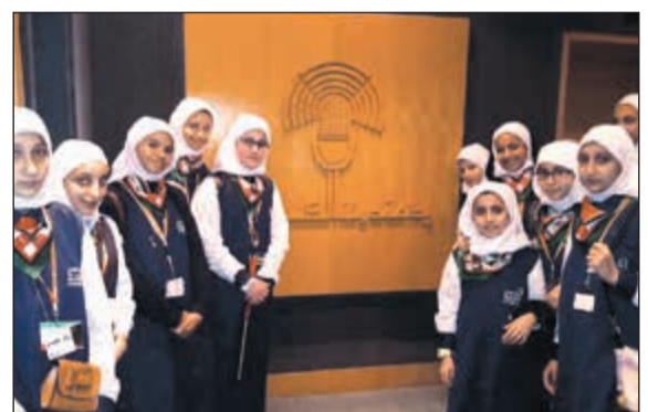
الطالبات بمبنى الإذاعة

بزيارة الطلاب مشيدين بدور مدارس النجاة ومسيرتها التعليمية المشرقة طوال العقود الماضية، وخلال الزيارة تمت المشاركة في البرنامج الجماهيري «البرنامج الثاني على الخط» تحدثت المشاركات من خلاله عن تجربتهن مع القراءة ومدى الاستفادة والوعي الكبير الذي تشكل لديهن من خلال الإقتباس والإبحار في بطون الكتب النهل من خبرات السابقين، وعبرت المشاركات عن عميق شكرهن للتعرف عن كتب على أهمية العمل الإعلامي في بناء الوطن والمواطن، وعكس قضايا المجتمع بحيادية وموضوعية وإيجابية.