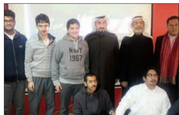
الطلاب الفائزون بمسابقة الدستور