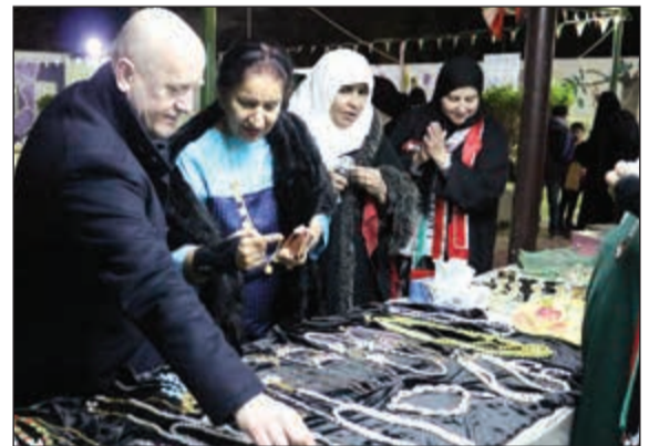
جولة على المعرض