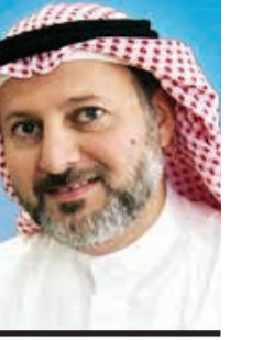
@drjasem د جاسم المطوع