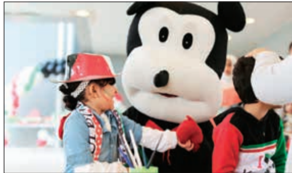
شخصيات كرتونية ورسم على الوجوه