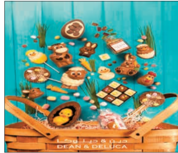
تشكيلات شبيهة من الشوكولاتة

بالإضافة إلى ذلك، ستتمكن العائلات من الاستمتاع بالعديد من الأنشطة المسلية خلال عطلة نهاية الأسبوع مثل الأشغال اليدوية وتزيين البسكويت والرسم على الوجه والتلوين وغيرها الكثير من ألعاب الموسم، ويمكنهم