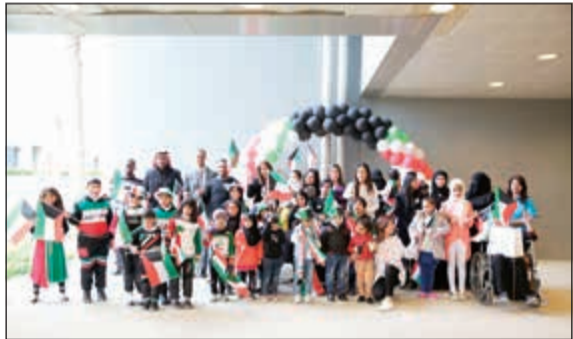
صورة جماعية لأطفال بيت عبدالله

قصيرة بالقرب من شاطئ الخليج العربي، لذا دعا فريق المنتجع الطفل وعائلته للاقامة لمدة لياليتين في واحدة من فله الرئاسية، وهو ما أسعد الطفل الذي أكد أن منتجع هيلتون هو المكان المثالي للراحة والاستجمام بالكويت.