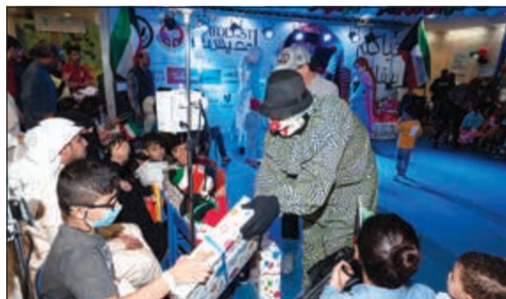
تقديم هدايا للأطفال

على جميع الأطفال من نزلء ومراجعين وبعد ذلك الذي رئيس مجموعة برنامج «يس» على سلطان كلمة شكر لإدارة مستشفى بنك الكويت الوطني والعاملين فيه وكل القائمين على الحفل. كانت شركة طلبات الراعي الرسمي لهذا الحدث بالإضافة إلى عدة جهات شاركت بالرعاية من ضمنها: مطعم ميس الغانم، شركة مجموعة فانتسي، شركة بروي «ليتس بلاي»، سيني ستار، شركة تيم وورك آي، وشركة أروي للطباعة والنشر. وأمديست هي منظمة غير ربحية أميركية بارزة عاملة في أنشطة دولية في التعليم والتدريب والتطوير في الشرق