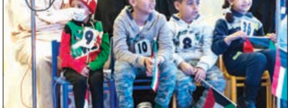
عدد من الأطفال خلال الحفل

اكتوبر من عام 2002 بعد أن قام بتحويله مكتب الشؤون الثقافية والتعليمية في وزارة الخارجية الأميركية بهدف تقديم المنح الدراسية لطلاب المدارس الثانوية في البلاد ذات الأثرية المسلمة لفترة تصل إلى ستة دراسية واحدة في الولايات المتحدة الأميركية، ويعمل هذا البرنامج على تعميق صلات التواصل بين الأميركيين والبلاد الصديقة وذلك عن طريق تقوية مشاعر التفاهم والاحترام المتبادل، وقد تخرج حتى الآن 170 طالباً وطالبة في البرنامج بعد تمثيلهم بلدهم الكويت حالياً ويوجد 12 طالباً في أميركا وسيتم ابتعاث الدفعة الجديدة في شهر أغسطس.