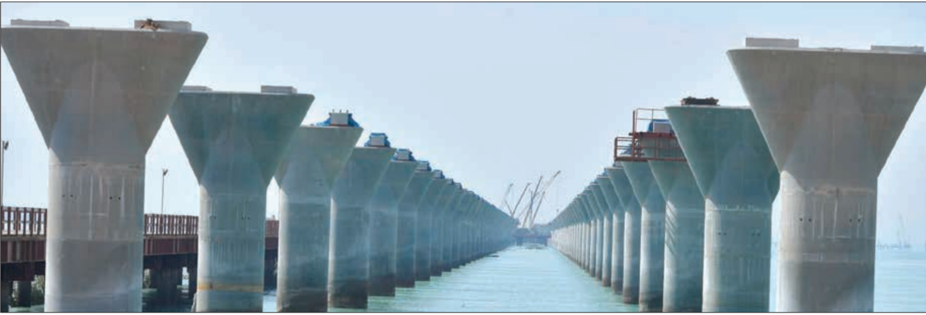
الاعمال جارية بمشروع جسر الشيخ جابر