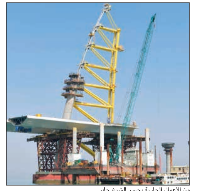
من الأعمال الجارية بجسر الشيخ جابر