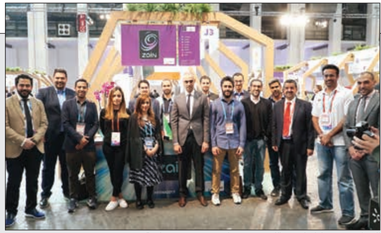
الخرافي يتوسط المبادرين الكويتيين بجناح «زين» في برشلونة

«زين» تحضن 8 مشاريع شبابية كويتية في معرض 4YFN لريادة الأعمال