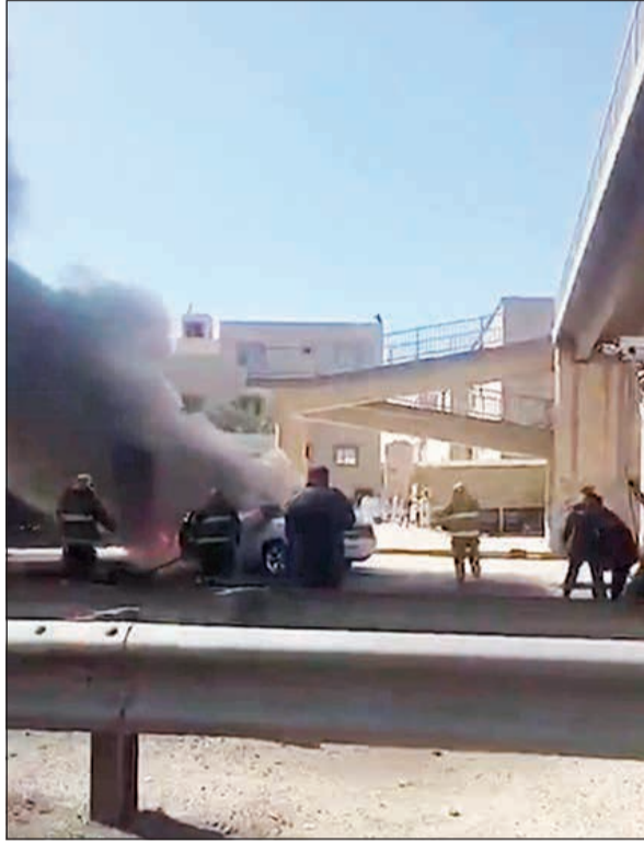
مقطع الفيديو الذي تم بثه

شرع رجال مباحث الجرائم الإلكترونية في البحث عن شاب قام بتصوير رجال الإطفاء والاستهزاء بهم أثناء العمل على إخماد حريق مركبة بمنطقة جابر العلي، وقال مصدر أمني أن رجال الجرائم الإلكترونية قاموا برصد حساب الشخص الذي بث مقطع الاستهزاء برجال الإطفاء والذي لاقى انتشاراً واسعاً في مواقع التواصل الاجتماعي، وأشار المصدر إلى أن التصوير ينحصر فقط للجهات المختصة بهدف معرفة أسباب الحادث ومتابعة نوع القضية، لكن تصوير الأشخاص للحوادث وغيرها قد يحيلهم للمساءلة القانونية لأنه يعكس رغبة في التشهير كالتالي قام بها صاحب الحساب الذي أفاد المصدر بأن المعلومات تدل على أنه مواطن ويحرض الأشخاص على الاستهزاء.