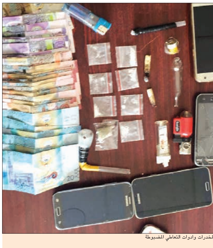
المخدرات وادوات التعاطي المضبوطة

في مخفر الجهراء. ومن جانب آخر تقدم وافد مصري وأبلغ عن تعرضه لعملية دهس من قبل إحدى المركبات أثناء عبوره طريق الدائري الرابع، وأفاد الوافد المصري بأن الداهس تعمد