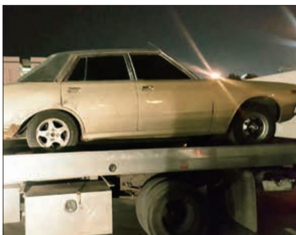
مركبة قديمة ضبطت في تيماء إلى كراج الحجز

شن رجال الأمن العام أمس حملة ليلية جديدة لملاحقة المستهترين في منطقة تيماء التي شهدت تجمها واستهتاراً على مدار الأيام الماضية، وتأتي الحملة لاستكمال الحملة الموسعة التي بدأت وزارة الداخلية بشنّها خلال الأيام الماضية، وذلك عقب تجمهرات شارع النجاشي في تيماء، وأسفرت حملة أمس عن ضبط عدد من المركبات الرياضية التي كان يتم الاستهتار بها في شارع النجاشي.