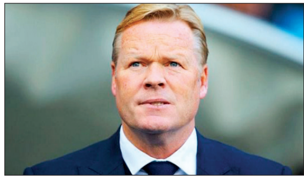
.. أم سيكون كومان هو المدرب القادم؟

بعد ليلة مجنونة وفوز كبير على سبورتنغ خيخون سداسية في ملعب «الكامب نو»، استكملت بإعلان المدرب لويس إنريكي عن رحيله عن برشلونة بنهاية الموسم الحالي. ولكن سرعان ما دخل سوق المراهنات بحسب صحيفة «أس» الإسبانية والتي أشارت إلى أن المرشحين بدأوا بالفعل أن يتوقعوا من المدرب المقبل للفريق الكتالوني. المرشحون بقوة من جانب السوق هما الفخاني ارنستو فالفييري والأرجنتيني خورخي سامبارولي مدرب اتلتيك بلباو وإشبيلية حيث تقاسما المبلغ وهو ما بين 4 و4.5 يورو. وجاء في المراكز الأخرى رونالد كومان مدرب يفرنون الإنجليزي بمبلغ 5 يورو، لوران بلان بمبلغ 8 يورو، خوان كارلوس أنزوي بمبلغ 10 يورو، فرانك ديبور 10 يورو، وماوريسيو بوكيتينو 10 يورو.