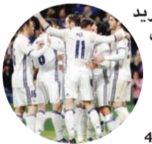
كسر فريق ريال مدريد الرقم التاريخي المسجل باسم غريمه التقليدي نادي برشلونة منذ 73 عاما، حيث كان الفريق الكاتالوني يملك سلسلة تسجيل متتالي في 44 مباراة.

ووفقا لما ذكرته شبكة «أوبتا» العالمية للإحصائيات، فإن الريال كسر هذا الرقم التاريخي المسجل باسم البارسا في أربعينيات القرن الماضي. ويهدف ايسكو في 8 مباريات في رمي لاس بالماس، أصبح المريغني يملك أفضل سلسلة تسجيل متتالي بتاريخ الدوري الإسباني. حيث بات الفريق الملكي يملك الآن 45 مباراة على التوالي يسجل فيها، في مختلف المسابقات التي يشارك فيها. ويحتل ريال مدريد المركز الثاني في جدول ترتيب الليغا برصيد 56 نقطة، أما برشلونة فتصدر جدول المسابقة بعد تعادل الملكي مع لاس بالماس.