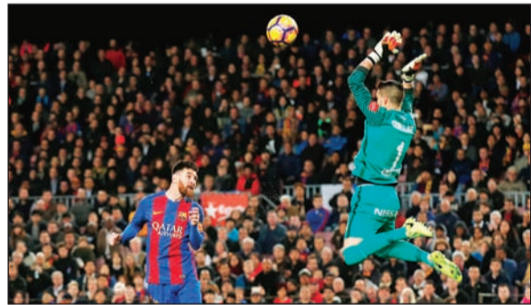
من لها غير ليو

الذي يسجل بخمس طرق مختلفة بالقدم اليمنى ويسرى وركلة حرة مباشرة، وكذلك ضربة رأس.