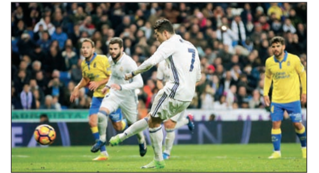
تبقى كبيرا يا كريستيانو

سجل اللاعب البرتغالي كريستيانو رونالدو هدفين في ثلاث دقائق لفريق ريال مدريد، ليضمن لفريقه عدم الخسارة في ملعبه سانتياغو برنابيو،