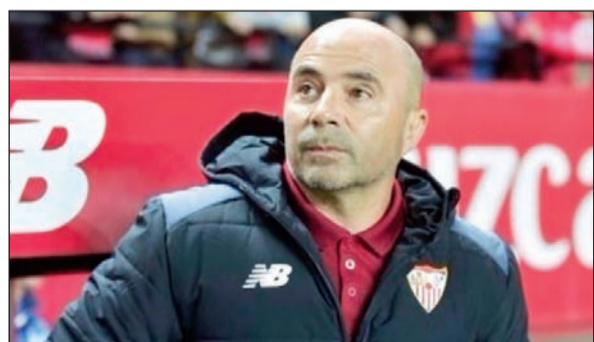
هل سيكون سامبارلي مدرب برشلونة المقبل؟

بعد ليلة مجنونة وفوز كبير على سبورتنغ خيخون سداسية في ملعب «الكامب نو»، استكملت بإعلان المدرب لويس إنريكي عن رحيله عن برشلونة بنهاية الموسم الحالي. ولكن سرعان ما دخل سوق المراهنات بحسب صحيفة «أس» الإسبانية والتي أشارت إلى أن المرشحين بدأوا بالفعل أن يتوقعوا من المدرب المقبل للفريق الكتالوني. المرشحون بقوة من جانب السوق هما الفخاني ارنستو فالفييري والأرجنتيني خورخي سامبارولي مدرب اتلتيك بلباو وإشبيلية حيث تقاسما المبلغ وهو ما بين 4 و4.5 يورو. وجاء في المراكز الأخرى رونالد كومان مدرب يفرنون الإنجليزي بمبلغ 5 يورو، لوران بلان بمبلغ 8 يورو، خوان كارلوس أنزوي بمبلغ 10 يورو، فرانك ديبور 10 يورو، وماوريسيو بوكيتينو 10 يورو.