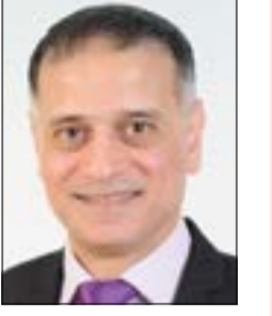
إعداد: د. طارق البكري