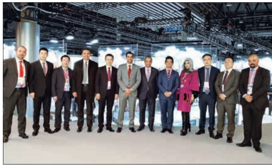
لقطة جماعية تضم إداريي Ooredoo وهاوي

عضو مجلس إدارة هاوي ستييفن بي التزام الشركة بدعم شركائها في قطاع الاتصالات، مؤكداً أن هاوي تعمل إلى جانب Ooredoo لتطوير شبكتها بشكل مستمر، وقال في تصريح له: نحن سعداء بشراكتنا مع Ooredoo الكويت، أحد أهم شركائنا حيث عملنا على عدة مشاريع متعلقة بتكنولوجيا الاتصالات مثل تطوير البنية التحتية حتى يتسنى لها استيعاب أحدث تطورات تكنولوجيا الاتصالات.