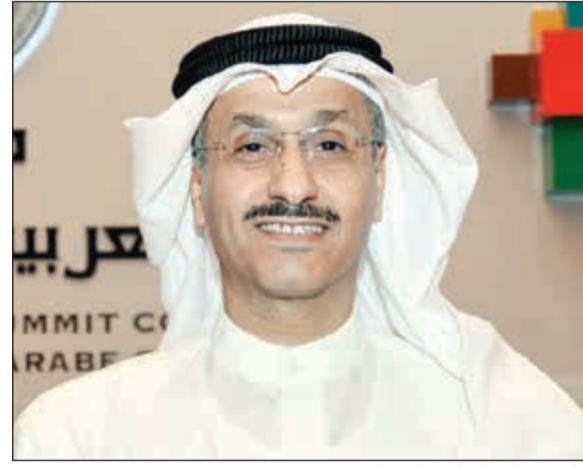
وكيل وزارة الإعلام طارق المرزوم