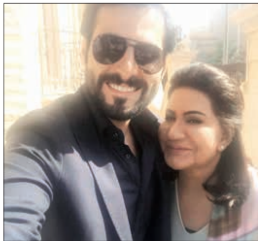
كاكولي مع الفنانة القديرة سعاد عبدالله

وغادر كاكولي إلى المنامة لتصوير مشاهد في المسلسل ومن المقرر أن يرافقه فريق العمل برحلات أخرى إلى دول أوروبية لتصوير بقية المشاهد، حيث يصور العمل بين الكويت والبحرين وعدد من المدن الأوروبية. الجدير بالذكر أن «كان يا ما كان» سيشهد مشاركة العديد من النجوم، منهم، بجانب علي كاكولي وسعاد عبدالله كل من شجون الهاجري وفاطمة الصفي وفيسل العميري وحمد أشكناي وفرح الصراف وغيرهم من النجوم الشباب.