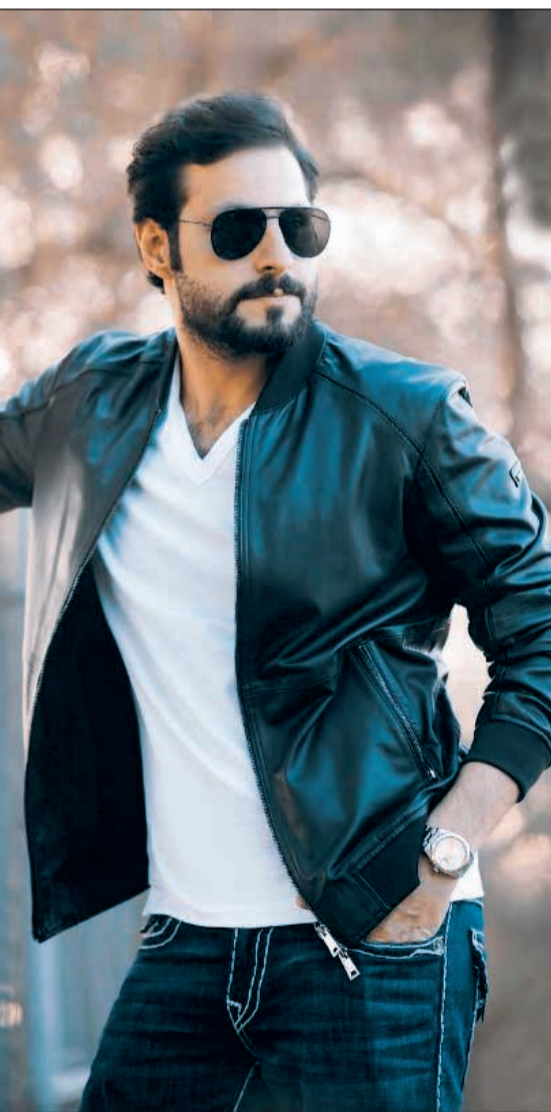
النجم علي كاكولي