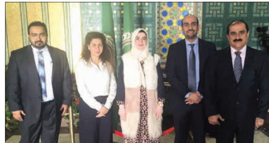
وقد الكويت إلى الاجتماع في لفة جماعية (ناصر عبد السيد)

المرأة يعني الاهتمام بصحة الأجيال القادمة، مؤكدة أن الكويت عملت على حماية