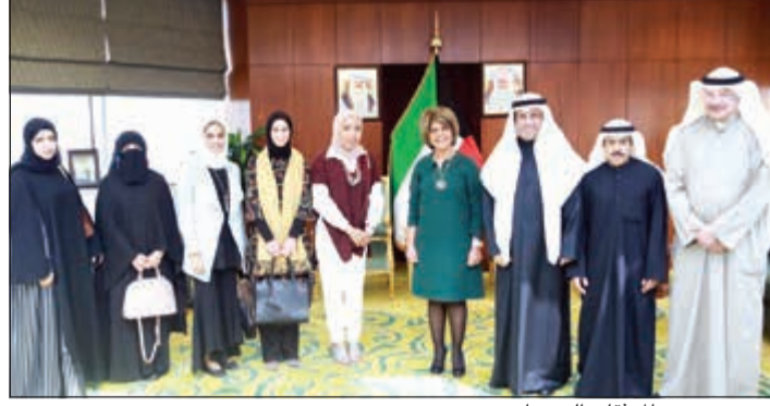
..ومع عدد من الموثقين الجدد