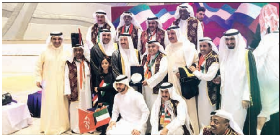
تكريم فرقة الجهراء للفنون الشعبية بعد مشاركتها في حفل سفارتنا في أبوظبي بمناسبة الأعياد الوطنية

ووجدنا هناك سواء من سفارة الكويت أو المسؤولين في دولة الإمارات العربية، وهذا ليس بغريب عليهم فهم أهل لذلك، وهذا هو معدن أهل وأبناء الخليج، وخصوصاً دولة الإمارات التي هي دائماً سبقة في المشاركات الوطنية للكويت.