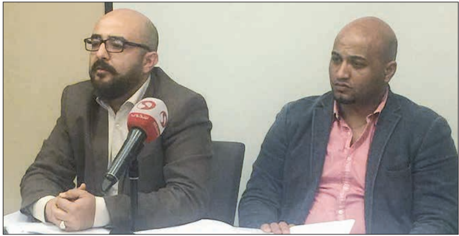
جانب من المؤتمر الصحافي

المبالغ نحو 100 ألف دولار وذلك خوفاً من تكرار ما حدث في العام الماضي من إخلال بالعقد.