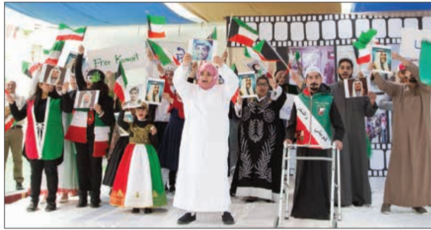
تلاميذ مدرسة التربية النموذجية يقدمون عملا مسرحيا

وتوفر مدرسة التربية النموذجية التعليم والدعم اللازم للطلبة من ذوي الاحتياجات الخاصة بمختلف مستويات الإعاقة لديهم، وتشمل الفئة العمرية من 6 إلى 21 عاما، وذلك بهدف تطوير إمكانيات الطلبة واستقلاليتهم، من خلال البرامج