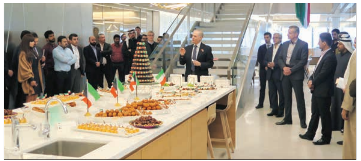
جانب من الاحتفالات في مكاتب الشركة في برج الحمراء

ويهدف البرنامج إلى تعزيز قدرات العاملين والمتعاملين في مجال الأغذية وتعريفهم على سياسات وأجراءات وقوانين ومصطلحات وارشادات