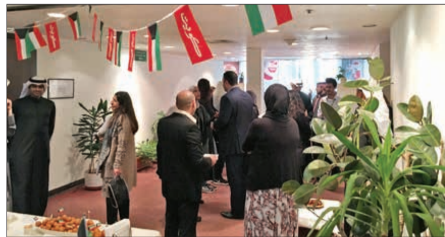
لقطة من الاحتفالات في مكاتب الشركة في الشويخ