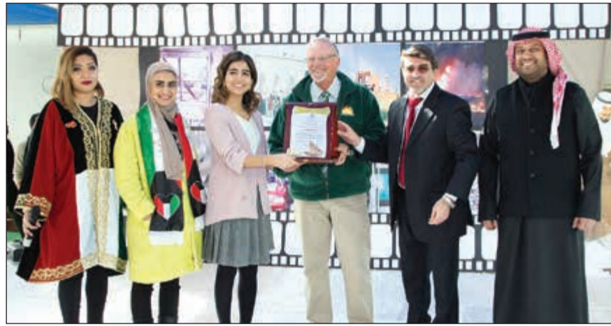
ممثلو بنك الخليج يتسلمون درعا تقديرية من مدرسة التربية النموذجية

والنمو لهم من الناحية التعليمية والعاطفية والجسدية والمهنية، وذلك ليس فقط من خلال المناهج الواضحة بل أيضا من خلال الأنشطة اليومية، كل هذا يتوافر في بيئة تعليمية آمنة تبعث على الأمل والرغبة في النمو وتعزز التقدم العلاجي، ويلتزم بنك الخليج بولائه الكامل للكويت الحبيبة وبدعمه المتواصل للمجتمع من خلال تقديم الرعاية للعديد من المبادرات التي تركز على الشباب والتعليم والصحة واللياقة البدنية ومساعدة المحتاجين وتمكين المرأة بالإضافة إلى التركيز على دعم الأنشطة والفعاليات التي تعزز التراث الكويتي الأصيل.