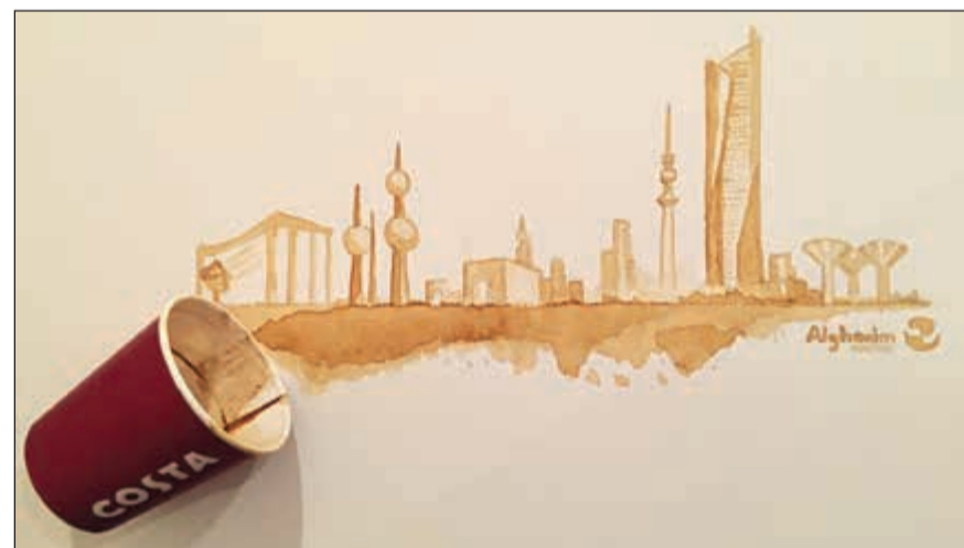
الصورة الفائزة في مسابقة الموظفين

نظمت شركة صناعات الغانم، إحدى أكبر الشركات الخاصة في المنطقة، فعالية ترفيهية لموظفيها يوم 21 فبراير 2017 للاحتفال بالعيد الوطني وعيد التحرير، وذلك في مقر الشركة الرئيسي في برج الحمراء وبمكاتبها في الشويخ. وبدأ الاحتفال بمجموعة من الأغاني الوطنية الكويتية التي أنشأتها الفرقة المحلية ذا كونسرت (The Concert)، وماكولات وحلويات كويتية تم توزيعها على الموظفين، وأخذ الموظفون صوراً تذكارية فورية في ركن تم تنسيقه ليعطي الطابع التراتي. وفي تعليقه على الاحتفالية،