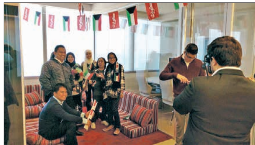
ركن التصوير الفوتوغرافي