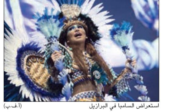
استعراض السامبا في البرازيل (أ.ف.ب)

أطلقت النجمة مونيكا بيلوتشي في افتتاح مهرجان بلغراد السينمائي. مونيكا البالغة 53 عاما، بدت متألقة بإطلالتها البسيطة الساحرة.