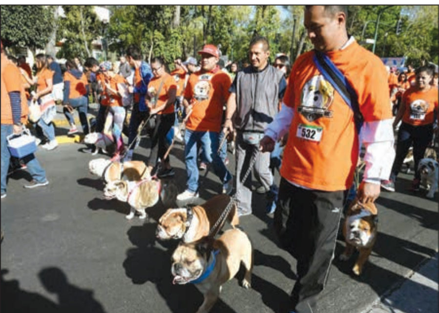
طابور عرض الكلاب

أصدرت وزارة الداخلية تعميمات لمنسوبيها في كل القطاعات بشأن مواصفات مواطن في العقد الثالث من عمره، وكذلك أوصاف وأقد سوري بهدف سرعة ضبطهما عقب هروبهما من نظارة أحد مخافر محافظة الأحمدى، فيما وجه وكيل وزارة الداخلية المساعد لشؤون الأمن العام اللواء إبراهيم الطراح باتخاذ الإجراءات القانونية اللازمة وتسجيل قضية ضد أحد رجال قوة المخفر بمسمى «الإهمال في رعاية سجين وتمكين مته من الهرب»، ووجه وكيل وزارة الداخلية المساعد لشؤون الأمن الجنائي اللواء عبدالحميد العوضي رجال إدارة مباحث