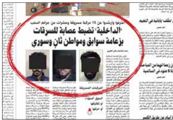
صورة من الخبر المنشور بـ «الانباء»

ما أشارت اليه «الانباء» في حينه، وتحديدا في تاريخ 11 فبراير الماضي، ونشرت صور جميع المتهمين ومن بينهم النزيل الهارب، إلى ذلك، قال مصدر ان هناك شكوكا حول تورط شخص من غير قوة المخفر هو المطلوب على ذمة قضايا سرقات والوافد السوري والذي استغل هروب اللص ليهرب هو الآخر حتى إشعار آخر وأنه يصدر الإبعاد. وذكر المصدر ان قوة المخفر اكتشفت ان النزيلين «اللس والسوري» قد اختفيا من داخل النظارة في ظروف غامضة، موضحا انه لا توجد آثار عنف على النظارة، وهو ما يدفع باتجاه احتمال تورط مجهول ما في عملية الهروب بنسبة كبيرة.