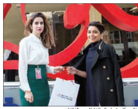
ممثل بركات تسلم الجائزة لإحدى الفائزات

وتشهرها. أما بالنسبة لتواريخ السحوبات القادمة فقد تم الإعلان عنها على النحو التالي: 30 مارس، 24 أبريل، 22 مايو، 29 يونيو، 24 يوليو، 30 أغسطس، 28 سبتمبر، 23 أكتوبر، 20 نوفمبر، 11 يناير 2018 وبالإضافة إلى جوائز «ابل» يحصل الطلاب على فرصة الفوز بسيارة «فيات» 500 موديل 2017، بمجرد تحويل إعادتهم الطلابية، كما بإمكانهم الحصول على تذكار سينما بقيمة دينارين فقط في جميع دور العرض التابعة لسينسكيب طوال أيام الأسبوع بانتسابهم فقط redTM، وعلاوة على ذلك، يحصل العملاء على عروض حصرية من «إدفعلي» وهي شركة لخدمات التسوق عبر الإنترنت.