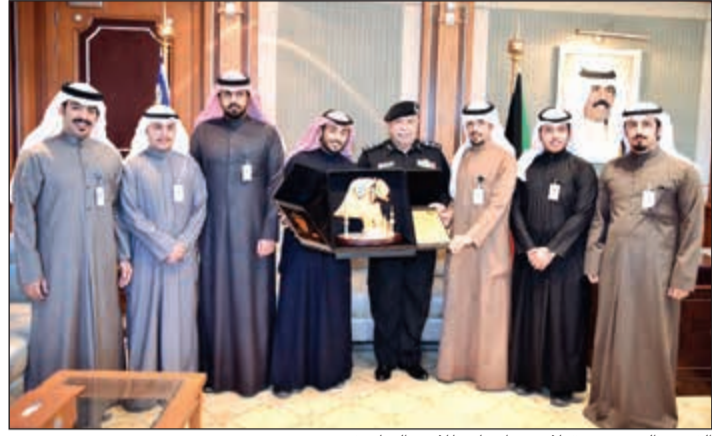
الفريق الفهد مستقبلا وفد اتحاد طلاب «التطبيقي»