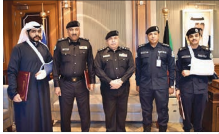
الفريق سليمان الفهد يتوسط المكرمين

من أجل تسهيل دراستهم ورفع مستوى تحصيلهم العلمي، وضمان عدم حدوث أي امر يؤثر على انتظام دراستهم ومستقبلهم. ولفت إلى ان الشعور بالأمان والطمانينة ينبع من عملية التكامل بالعمل الأمني بين الوزارة والمواطن والمقيم، ولا بد من التكاتف والتعاون في المرحلة الحالية للوصول إلى الغاية المنشودة بسواعد الشباب وفكرهم الواعد لبناء الوطن ونهضته ومستقبله.