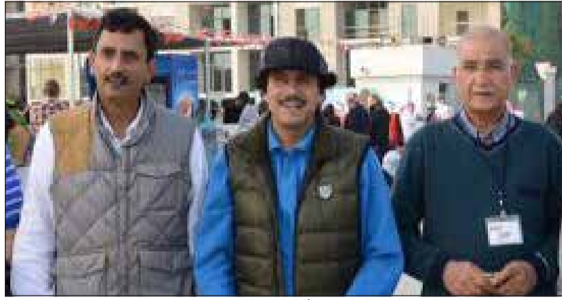
السفير الشيخ عزام الصباح ونواف خالد المرزوق أثناء الاحتفال

وأوضح ان المجلس سيستمع الى وزراء خارجية من مختلف دول العالم للتعرف على وجهات النظر المختلفة في التعامل مع التحديات المحيطة بتعزيز حقوق الإنسان.