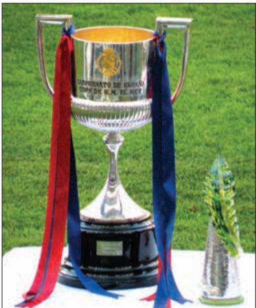
جواكيم مولينس طالب بتجريد الريال من أربع ألقاب كأس إسبانيا

قام جواكيم مولينس وهو أحد المساهمين في نادي برشلونة برفع طلب رسمي إلى الاتحاد الإسباني من أجل إعادة النظر في احتساب أربعة كأوس ملك فاز بها نادي ريال مدريد في الماضي.