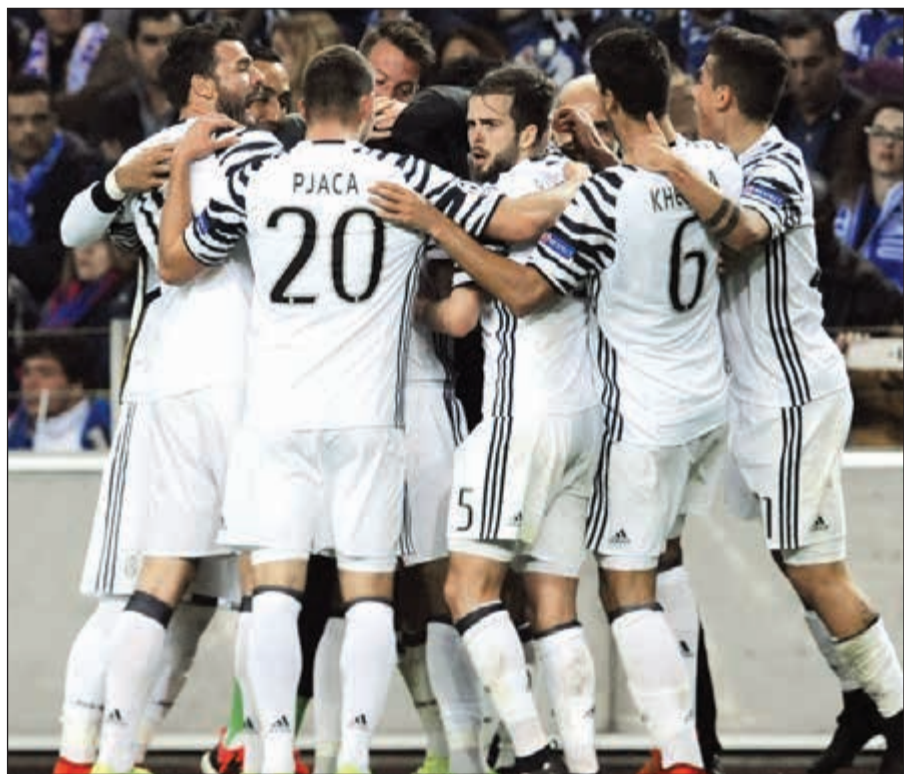
يوفنتوس يواجه امبولي بمعنويات مرتفعة بعد فوزه على بورتو البرتغالي في دوري أبطال أوروبا

تبدو الفرصة سانحة أمام يوفنتوس للاقتراب من لقبه السادس على التوالي عندما يواجه ضيفه المتواضع امبولي اليوم في المرحلة السادسة والعشرين من الدوري الإيطالي.