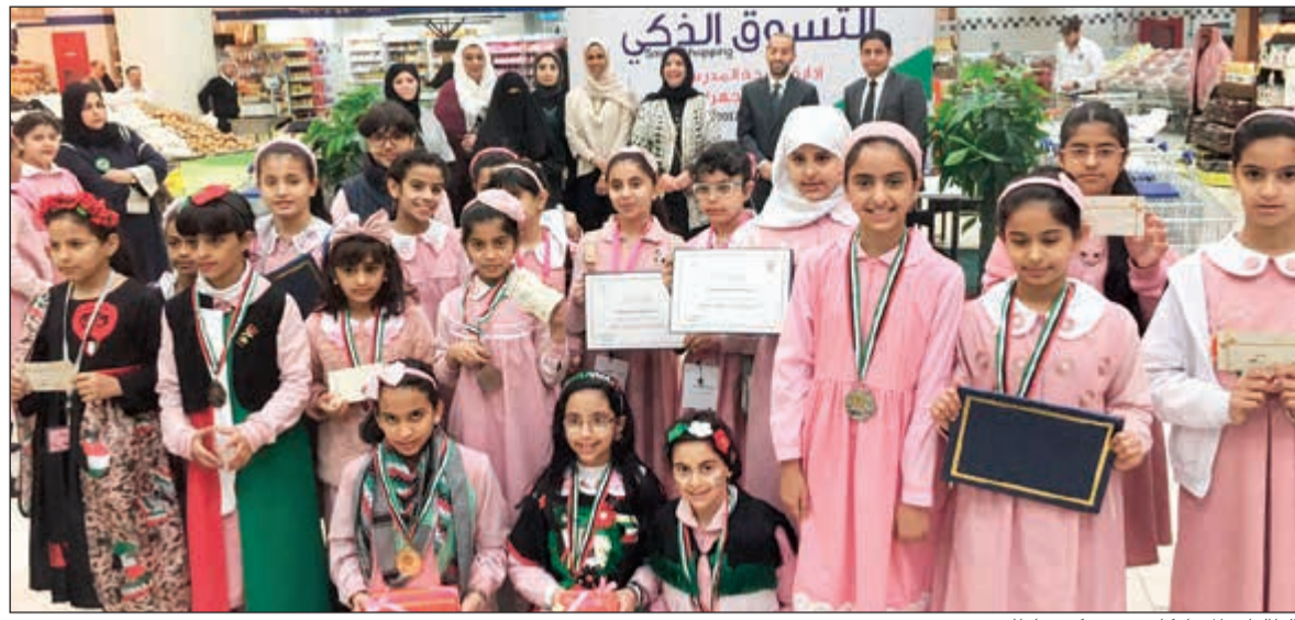
الطالبات المشاركات في مركز سلطان