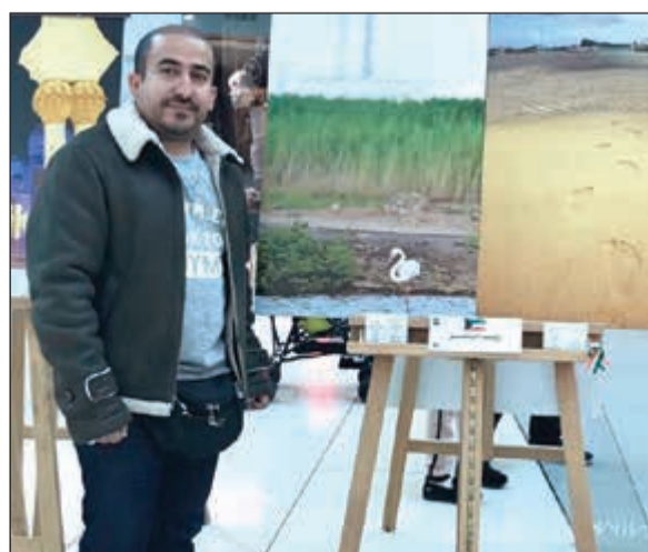
أحد المشاركين في المعرض