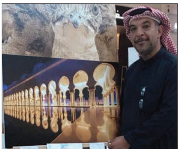
مشارك في المعرض

بالمزيد من الدورات المتقدمة والمتخصصة ومشاركتهم في المعارض.