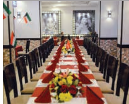
مطعم المحروسة من الداخل