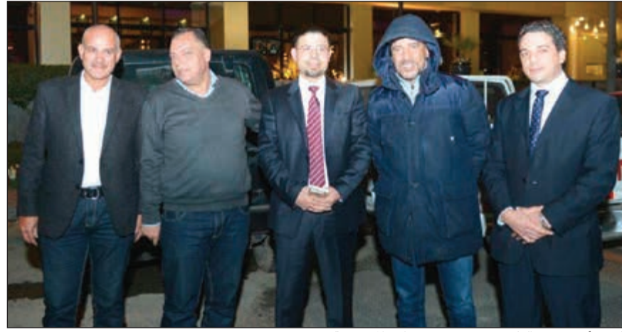
النجم أشرف عبدالباقى مع فريق عمل مطعم المحروسة