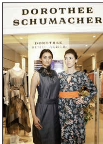
العارضات تعرضن أزياء المجموعة الجديدة من دوروثي شوماخر