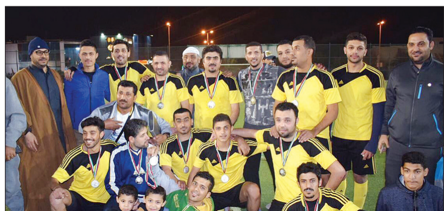
فريق شباب هجين الوصيف