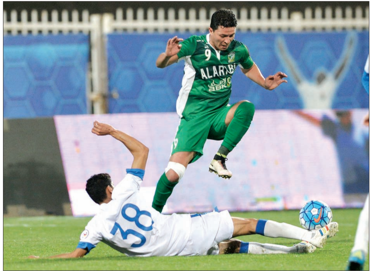
العربي يتخطى الجهراء بنجاح