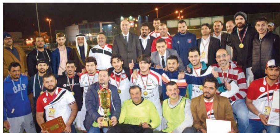
منتخب الجالية البطل مع عامر جديد ولبابيدي والضامن والتج والمظنن