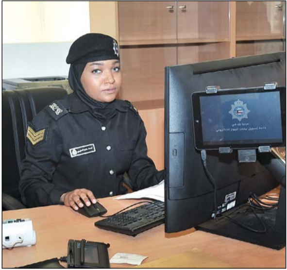
مرحبا بك في خدمة تسجيل بيانات الجواز الإلكتروني