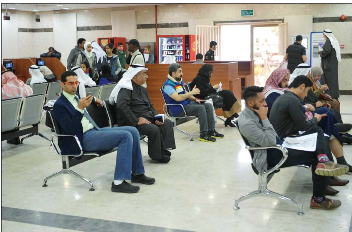
مراجعون بصدد تقديم طلبات الجوازات الجديدة