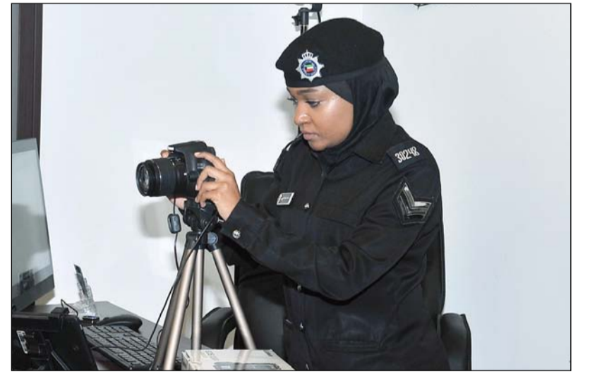
التصوير داخل مراكز الخدمة