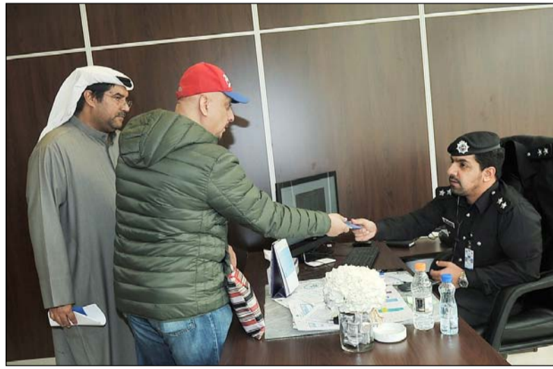
5 مراكز خدمة استقبلت المراجعين منها مركز اشبيلية لخدمة محافظة الفروانية