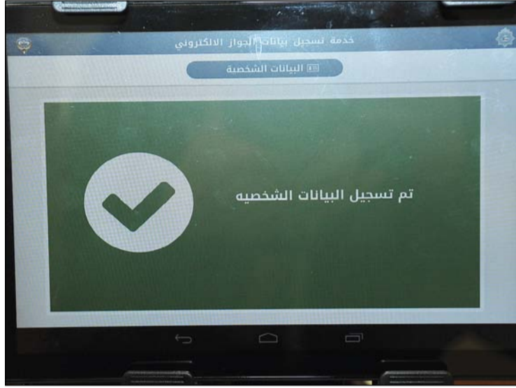
تم قبول الطلب