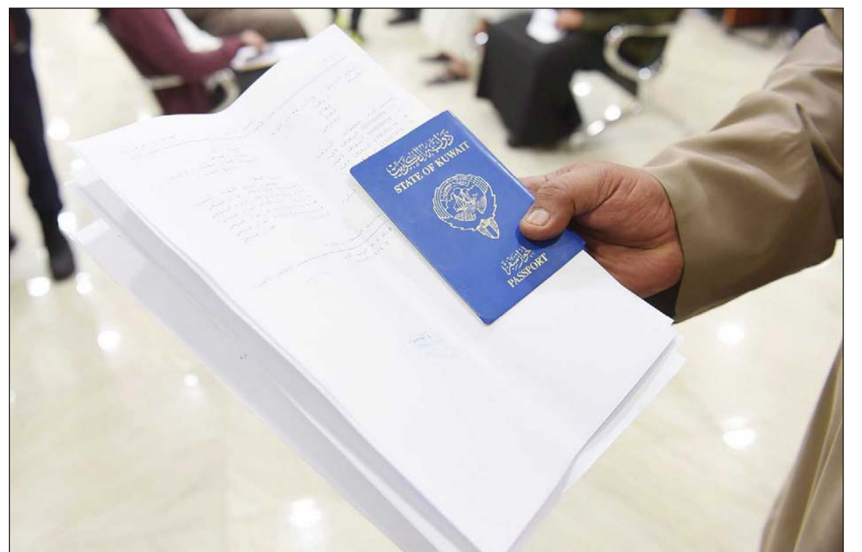
الجوازات الإلكترونية الجديدة يبدأ تسلمها الاثنين المقبل