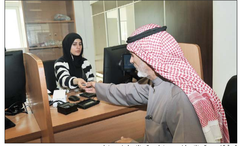
قيمة التجديد 3 دنانير لخمس سنوات و6 دنانير لعشر سنوات