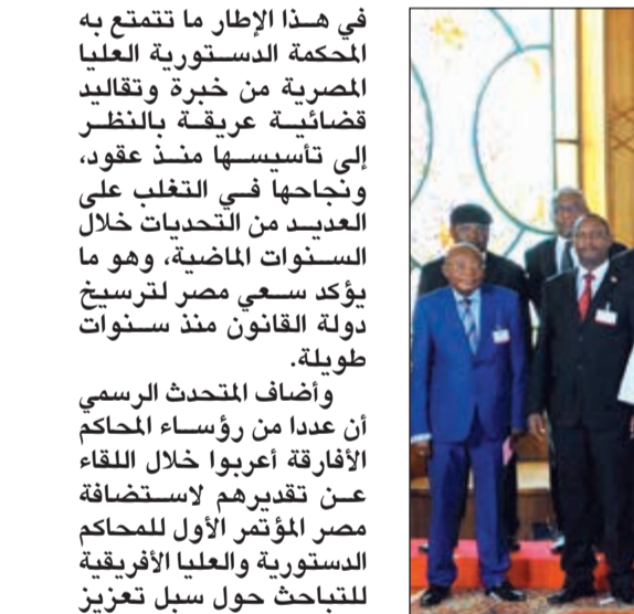
الرئيس المصري عبدالفتاح السيسي مستقبلاً رؤساء المحاكم الدستورية والعليا الأفارقة في القاهرة أمس

في هذا الإطار ما تتمتع به المحكمة الدستورية العليا المصرية من خبرة وتقاليد قضائية عريقة بالنظر إلى تأسيسها منذ عقود، ونجاحها في التغلب على العديد من التحديات خلال السنوات الماضية، وهو ما يؤكد سعي مصر لترسيخ دولة القانون منذ سنوات طويلة. وأضاف المتحدث الرسمي أن عدداً من رؤساء المحاكم الأفارقة أعربوا خلال اللقاء عن تقديرهم لاستضافة مصر المؤتمر الأول للمحاكم الدستورية والعليا الأفريقية للتباحث حول سبل تعزيز التعاون بين الدول الأفريقية في هذا المجال، مؤكداً ما يعكسه ذلك من حرص مصر على ترسيخ دولة القانون واستقلال القضاء، وهو ما يتطلعون إلى تعزيزه على المستوى الأفريقي. كما أكدوا ضرورة انتهاز فرصة عقد هذا المؤتمر في مصر للعمل على زيادة التواصل بين المحاكم الأفريقية.