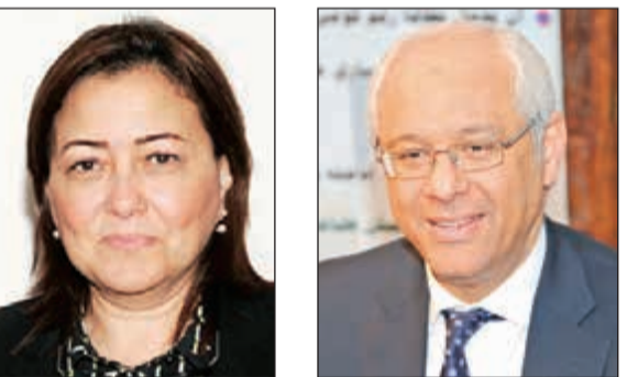
السفير ياسر عاطف، السفيرة هويدا عصام

في إطار مشاركة الجالية المصرية فرحة الشعب الكويتي في احتفالات العيد الوطني وعيد التحرير، تقيم الجالية المصرية يوماً ترفيهياً في قرية صباح الأحمد التراثية وذلك يوم الجمعة الموافق 24 فبراير، يتضمن الاحتفال فقرات فولكلورية مصرية وكويتية من فرق الفنون الشعبية وفرقة الحضان وفرقة النوبة للتراث الشعبي، وفرقة المسابقات الكويتية التي تقدم هدايا قيمة وموبيلات للفائزين. وفي ختام اليوم يلتقي الجميع في القاعة الأميرية لمشاهدة الحفل الفني الذي يحبه نجوم الأوبرا المصرية والبرنامج الشهير THE VOICE KIDS بقيادة المايسترو صلاح مصطفى، يحضر الحفل السفير المصري ياسر عاطف وقصص مصر في الكويت، السفيرة هويدا عصام وعدد من أعضاء الجبهة الدبلوماسية.