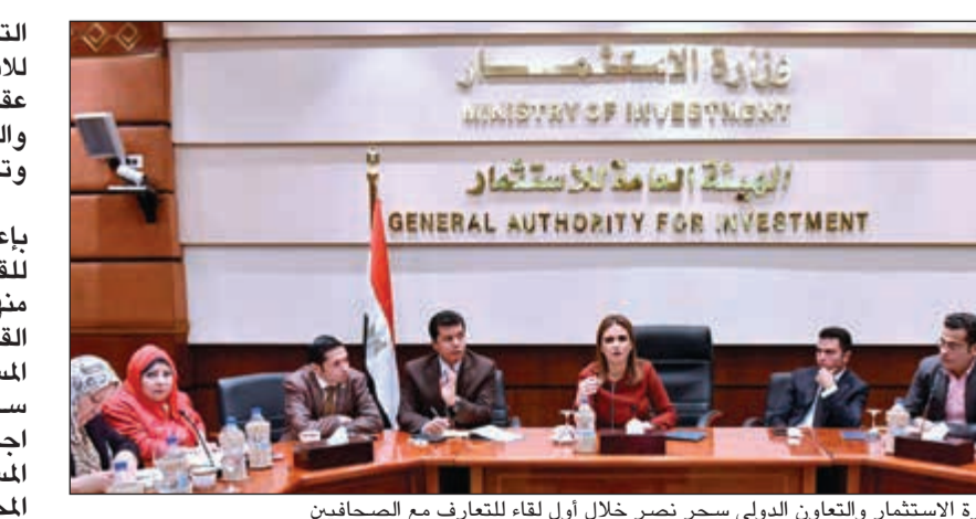
وزيرة الاستثمار والتعاون الدولي سحر نصر خلال أول لقاء للتعرف مع الصحفيين

التنفيذ للهيئة العامة للاستثمار محمد خضير، على عقد لقاء مع أعضاء البرلمان واللجان المختلفة للتواصل وتفسير مواد القانون. كما كلفت رئيس الهيئة بإعداد اللائحة التنفيذية للقانون الجديد والانتهاز منها خلال شهر مارس لتفعيل القانون حال صدوره وجذب المستثمرين. وأشارت إلى أنه ستعقد خلال الفترة المقبلة اجتماعات مع جمعيات المستثمرين في مختلف المحافظات والتعرف على مشاكلهم وفي مقدمتها إزالة البيروقراطية وتيسير حصول المستثمر على الخدمات اللازمة. موضحة أن هناك اهتماماً بالمستثمر الصغير وليس الكبير فقط. وأشارت إلى أن الوزارة