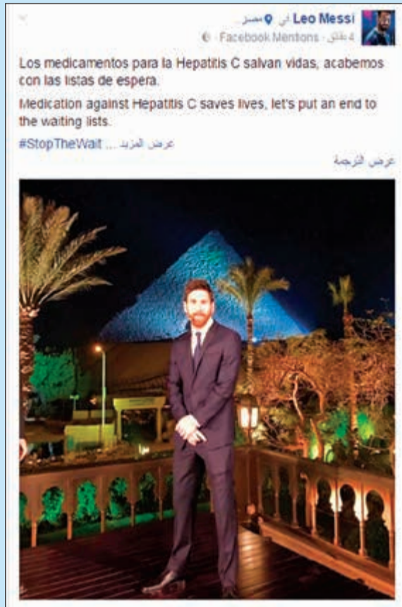
الصفحة الرئيسية لحساب ميسي على «فيسبوك»