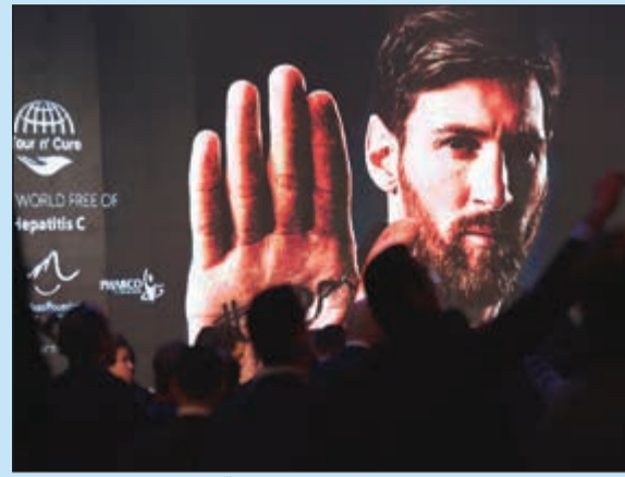
جانب من حفل استقبال النجم العالمي في القاهرة أمس الأول