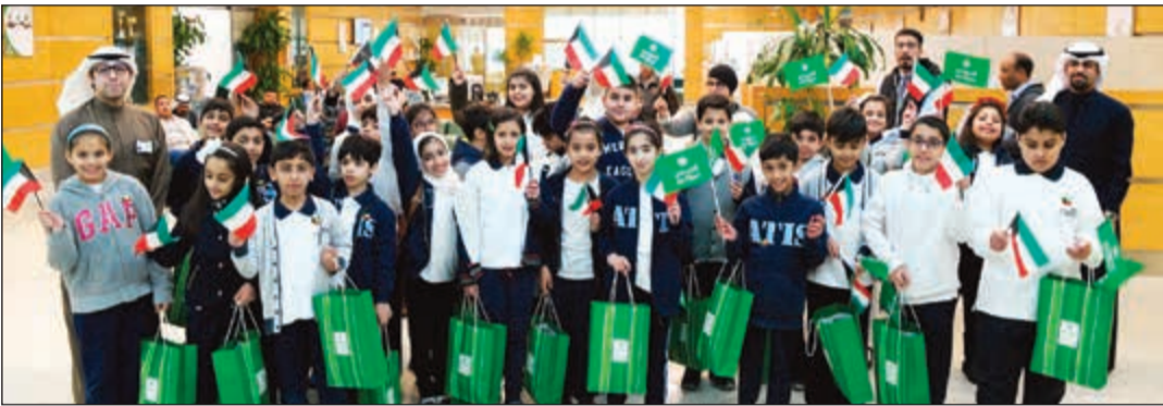
هدايا من «التجاري» للطلبة خلال الحفل.

هذا اليوم بالقرب من المبنى الرئيسي الذي تم تزيينه بأعلام الكويت وذلك تزامناً مع احتفالات العيد الوطني وعيد التحرير، والاستقبال طلبة مدرسة التكامل وعدد كبير من الضيوف والعملاء والزوار الذين استمتعوا بحسن الضيافة من المأكولات الشعبية والحلوى التقليدية التي أعدت خصوصاً لهذه المناسبة. وفي ختام الزيارة، تقدمت إدارة مدرسة التكامل بالشكر والتقدير إلى إدارة البنك التجاري على استضافتهم لطلبة المدرسة ومشاركتهم أسرة البنك الاحتفالية التي أدخلت البهجة والفرح لقلوب الطلبة، وأتاحت لهم فرصة التعبير عن حسيهم الوطني، متمنين للبنك مزيداً من التقدم والعباء.