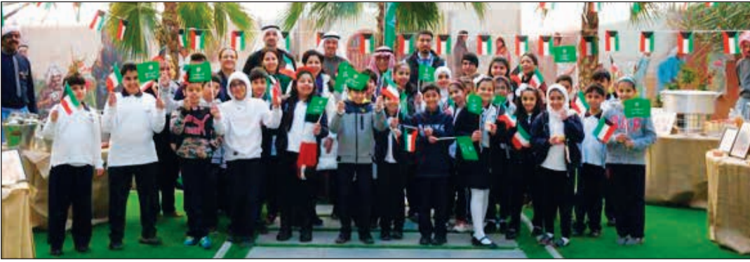
لقطة تذكارية مع طلبة «التكامل».