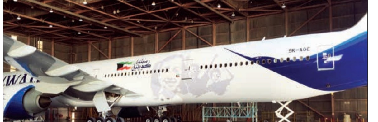
«كاظمة» بجلتها الجديدة

شبكة وجهاتها المنتشرة حول العالم من خلال اللغة البصرية الجمالية والوطنية التي تكتسي بها طائرة الكويتية. جدير بالذكر أن التصميمات الوطنية والاحتفالية التي تكسو جسم الطائرة الجديدة «كاظمة»، هي ضمن مجموعة من الحملات والفعاليات تنظمها الخطوط الجوية الكويتية بمناسبة الاحتفالات الوطنية خلال شهر فبراير، حيث أطلقت الكويتية عملاً إعلانياً يعكس الفخر والاعتزاز بالكويت من خلال منجزات أبناء الوطن في شتى المجالات تحت شعار «سماؤنا كويتية»، ليعبر عن الروح الوطنية المسؤولة والقدرات الإبداعية للشباب الكويتي كل في مجال عطائه.