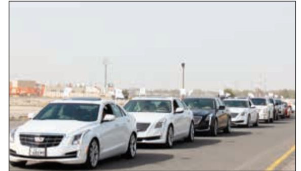
موكب سيارات كاديلاك

قدمت شركة يوسف أحمد الغانم وأولاده، الوكيل الحصري لسيارات كاديلاك في الكويت، رعايتها لمجموعة كاديلاك الكويت في تنظيمها موكب الأضخم لسيارات كاديلاك يوم السبت 18 فبراير 2017. وتميز الحدث لهذا العام بحضور السفير الأميركي لورانس سيلفرمان الذي شكل وجوده تشجيعاً للعشاق هذه السيارة المميزة والتي تعتبر رمزاً من رموز الرفاهية مع وجود عدد من أحدث طرازات وموديلات كاديلاك الفخمة والتي شملت موديل CT6 الذي تم إطلاقه مؤخراً ضمن باقة سيارات الرفاهية والفخامة التي شملت أيضاً موديلات CTS، ATS، V-SERIES، XT5 ورمز القوة والرفاهية الكبيرة، كاديلاك اسكاليد. كما شاركت في الموكب أندية كاديلاك من السعودية، الإمارات، قطر، البحرين، وعمان، وبلغ عدد المشاركين في هذا الموكب الضخم حوالي 100