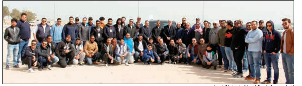
لقطة جماعية لأندية كاديلاك المشاركة في الحدث

أكدت شركة عبدالمحسن عبدالعزیز الباطين، الموزع المعتمد لسيارات «نيسان» الكويتية، من خلال مشاركتها في احتفالات العيد الوطني وعيد التحرير في الكويت، وهنأت الشركة الكويت، أملة لشعبها والمقيمين فيها تحقيق المزيد من النجاحات والصحة والازدهار. وأشارت الباطين إلى أنه بالتزامن مع فعاليات مهرجان «هلا فبراير»، فقد أضاءت صالة