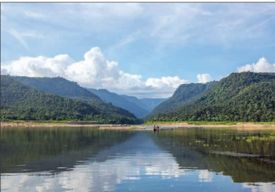
مدينة سايليت البنغالية