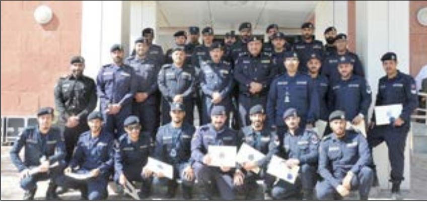
الفريق المكراد واللواء البليهيص يتوسمان فرق الاطفاء المكرمين