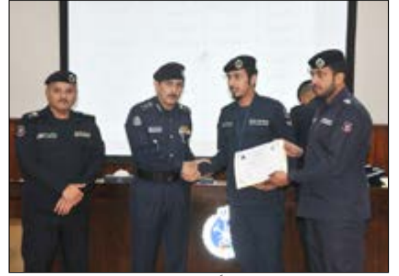
الفريق خالد المكراد مكرما إطفائيا شارك في التدريب

التمارين ستستمر لرفع كفاءة رجال الإطفاء العاملين على جميع الحوادث بأنواعها المختلفة، كما شكر المكراد والبليهيص رئيس فريق خالد المهيني وجميع الضباط المشرفين على المسابقة.