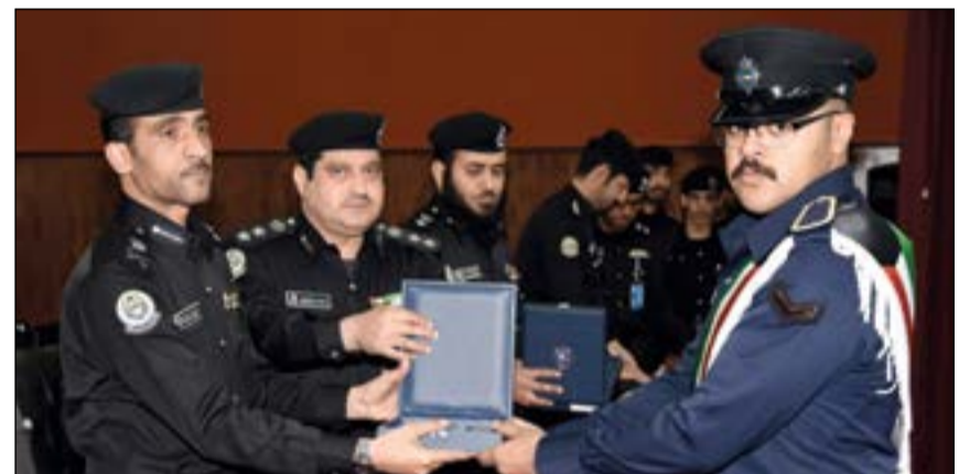
اللواء بورسلي يسلم احد الخريجين شهادة التخرج

اختراق القوانين. وأعرب عن شكره وتقديره لكل من قام بتأهيلهم في مدرسة الشرطة وأكاديمية سعد العبدالله للعلوم الأمنية، داعيا الله أن يحفظ الكويت وصاحب السمو الأمير الشيخ صباح الأحمد وسمو ولي العهد الشيخ نواف الأحمد والكويت وشعبها. وفي كلمة لمدير مدرسة الشرطة العقيد محمد الرومي أكد فيها ان إدارة مدرسة الشرطة تعمل على التحديث والإرتقاء بالقطاع التعليمي الخاص بضباط الصف والأفراد، مستعينة بكلمات صاحب السمو الأمير