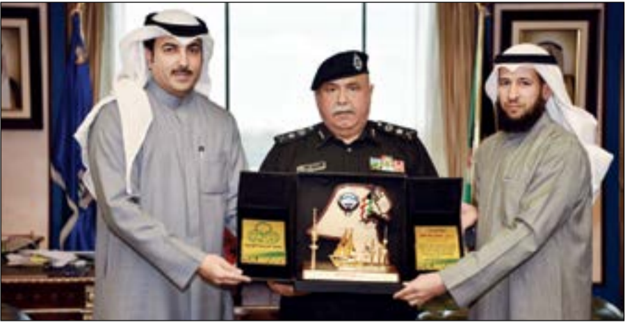
الفريق سليمان الفهد يتسلم درعا تذكارية من رئيس جمعية الفروانية

وسام الاقتراحات والحلول المناسبة لها، كما تم خلال اللقاء بحث عدد من الموضوعات واستعراض المشاكل والأزمات المرورية التي تعاني منها منطقة الفروانية خصوصا عند المداخل والمخارج، وعلى الطرق الرئيسية في المحافظة. وودع الفريق الرئيسية في المحافظة القطاعات المعنية لتقديم الاقتراحات والحلول المناسبة لها، مؤكداً ان وزارة الداخلية لن تدخر جهدا في تقديم المساعدة والاعون للمجتمع. وفي ختام اللقاء قدم رئيس الجمعية درعا تذكارية للفريق الفهد تقديرا لجهوده في خدمة المواطنين والمقيمين والحرس على أمنهم وسلامتهم.