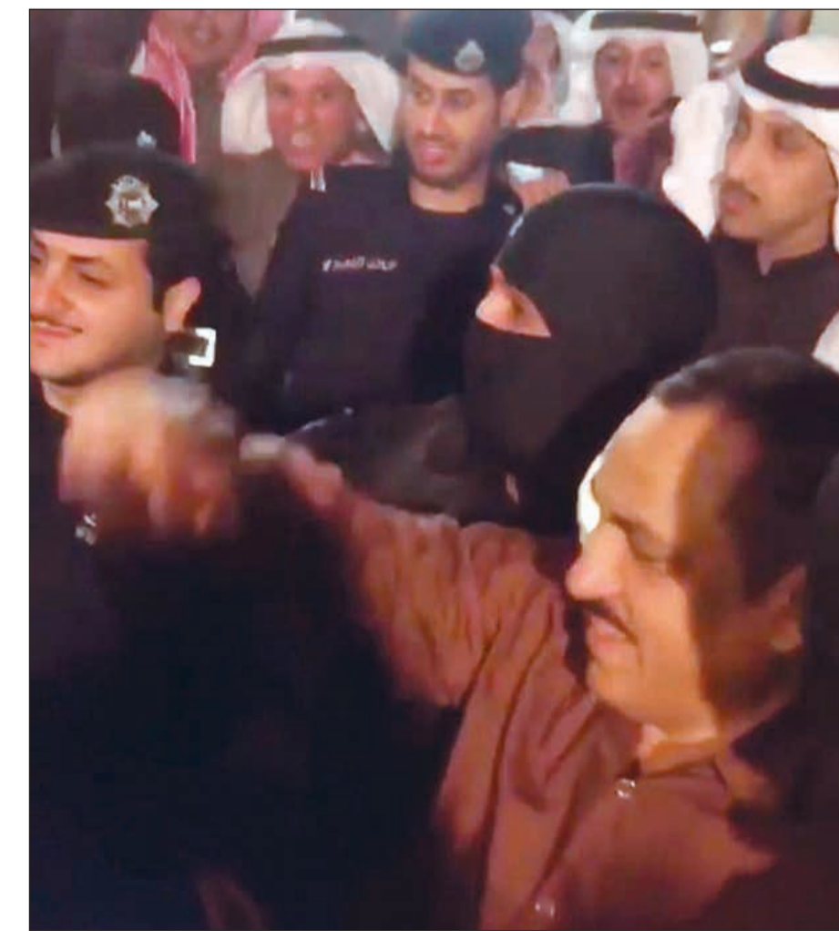
مسلم البراك لحظة خروجه من المستشفى