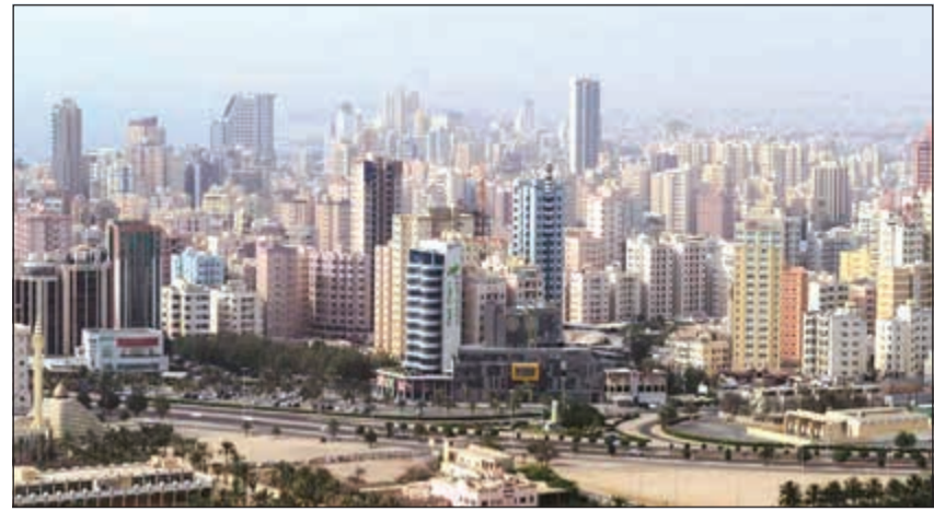
تراجع طفيف للتداولات العقارية خلال يناير الماضي