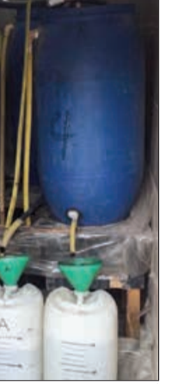
أدوات التقطير وبراميل الخمور