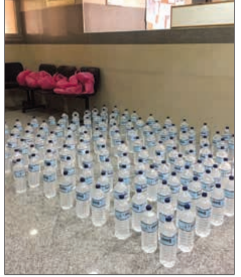
قناتي خمور المهبولة