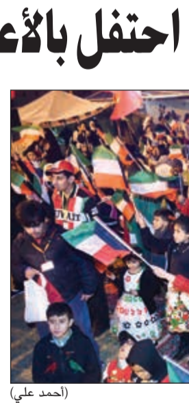
حضور غفير في احتفال مركز الخرافي لأنشطة الأطفال المعاقين (أحمد علي)

من ذوي الإعاقة في المجتمع، لافتاً إلى أن مثل تلك الفعاليات تأتي تحفيزاً لقدراتهم وتطويراً لامكانياتهم، بالإضافة إلى كونها تسعى إلى ترسيخ العادات والتقاليد الشعبية والوطنية الأصيلة بالكويت.