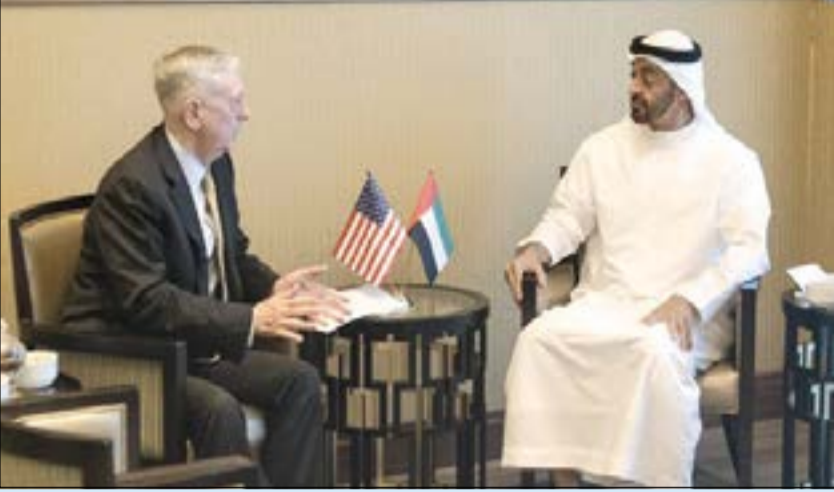
صاحب السمو الشيخ محمد بن زايد آل نهيان ولي عهد أبوظبي نائب القائد الأعلى للقوات المسلحة خلال مباحثاته مع وزير الدفاع الأمريكي جيمس ماتيس

الولايات المتحدة الأميركية وسبل تعزيزها وتطويرها وبشكل خاص تعاون البلدين في الشؤون العسكرية والدفاعية. وتم استعراض مجمل القضايا الإقليمية والدولية والتطورات الراهنة في المنطقة خاصة فيما يتعلق بالجهود والتنسيق المشترك بين البلدين في محاربة التطرف والعنف والتنظيمات الإرهابية ودور البلدين في إرساء دعائم الأمن والاستقرار والتدري لمصادر التهديدات التي تقوض السلام في المنطقة. وتطرق الجانبان كذلك إلى عدد من الموضوعات ذات الاهتمام المشترك وتبادلا الرأي ووجهات النظر حولها.