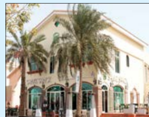
مبنى مطعم شيك شاك في البدع

مجموعة متنوعة من المواد المعاد تدويرها والمستدامة في فرع البدع تماشياً مع مسؤولية المطعم تجاه البيئة، كما تم استخدام إضاءة الـ LED في جميع أنحاء المطعم، واستخدم الخشب المعاد تدويره من الأسوار