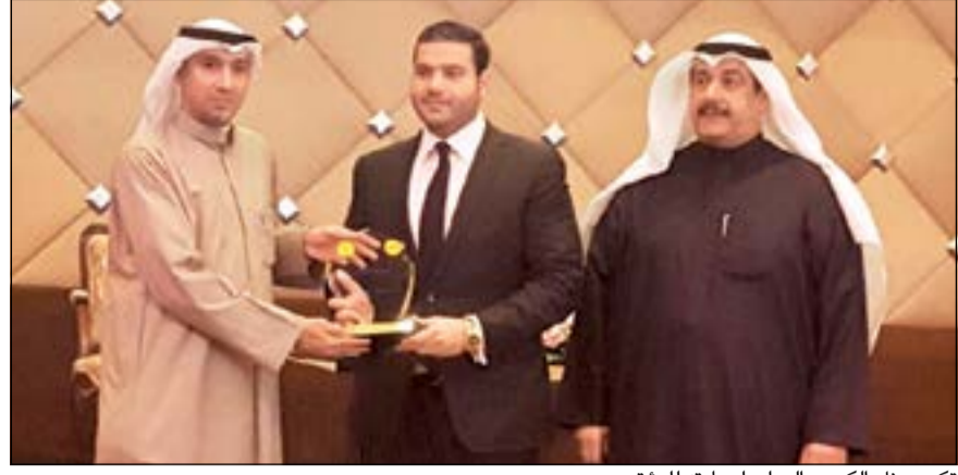
تكريم بنك الكويت الدولي لرعايته للمؤتمر

انطلاقاً من مسؤوليته الاجتماعية تجاه شريحة الشباب، قدم بنك الكويت الدولي مؤخراً رعايته الذهبية لمؤتمر «واعي» الأول للقاية من المخدرات والعنف، والذي نظمه الجمعية الصيدلانية الكويتية تحت رعاية وزارة الدولة لشؤون الشباب وبمشاركة مجموعة من المؤسسات الاقتصادية والتربوية والصحية البارزة في البلاد.