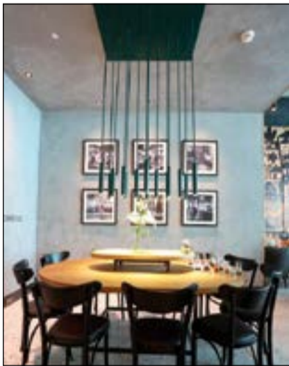
أجواء مميزة لتناول القهوة