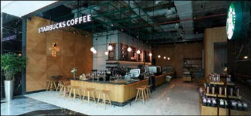
مقهى ستاربكس في برج كريستال

المفضلة لدى زبائننا في الكويت. ويأتي تصميم المقهى مميز، بفضل الكسوة الخشبية التي تعبت الإحساس بالدفء، والألوان المثلثة الشكل المستوحاة من أحجار الكريستال الطبيعية، وتندمج السمات التي تميز المكان مع هذا التصميم الجذاب بسقوفه الخرسانية الجوفة بوحدة الإنارة الغائرة وأسطح القرميد المكشوفة.