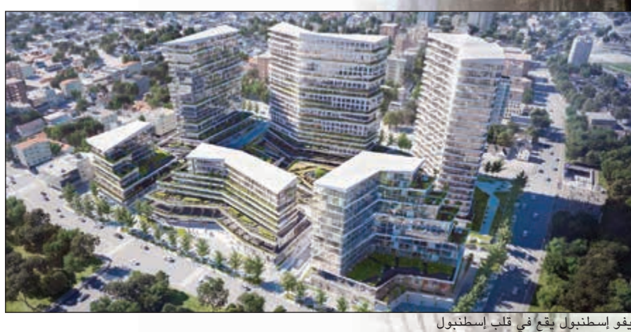
نيفو إسطنبول يقع في قلب إسطنبول

وأضافت: «(إعمار الشرق الأوسط) تعمل وفق استراتيجية دقيقة ومدروسة لتحقيق أهدافها الموضوعية بتان، حيث بدأنا بالدخول في سوق العقار الدولي كمسوقين أولاً من خلال اختيار أسواق مستقرة وآمنة ومرغوبة وعقد تفاهات