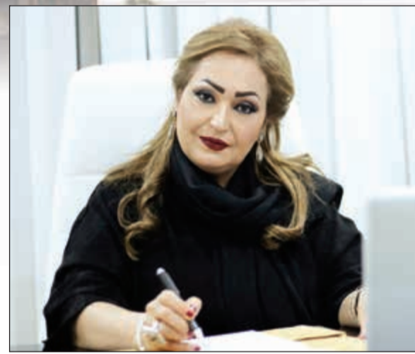
الشيخة فاطمة الصباح

وأضافت: «نطرح مشروع هيروكولانيوم ذا الموقع المميز على الطريق المباشر الذي يقودك إلى وسط المدينة، وهو مشروع تطويري خلاب بالقرب من نهر ميرسي ويتمتع باطلالة بحرية رائعة وعلى مقربة من ساحل بيرل وغير بعيد من الجبال اليزلية ذات الطبيعة الخلابة، ويتمتع (هيروكولانيوم) أيضاً باطلالة مذهلة على ليفربول مارينا حيث ترسو العديد من