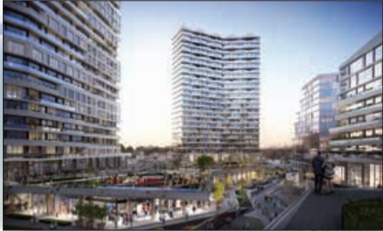
نيفو إسطنبول من المشاريع القوية في تركيا

يبلغ إجمالي استثمارات المشروع 13 مليار جنيه. والقمة البيعية المستهدفة تقدر بـ20 مليار جنيه. كما أن هذه المساحة ستضم خدمات متنوعة منها نادي وادي دجلة ومدرسة وعيادات طبية وحضانات ومساحات تجارية وإدارية ضخمة..