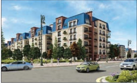
نيوبلس القاهرة الجديدة