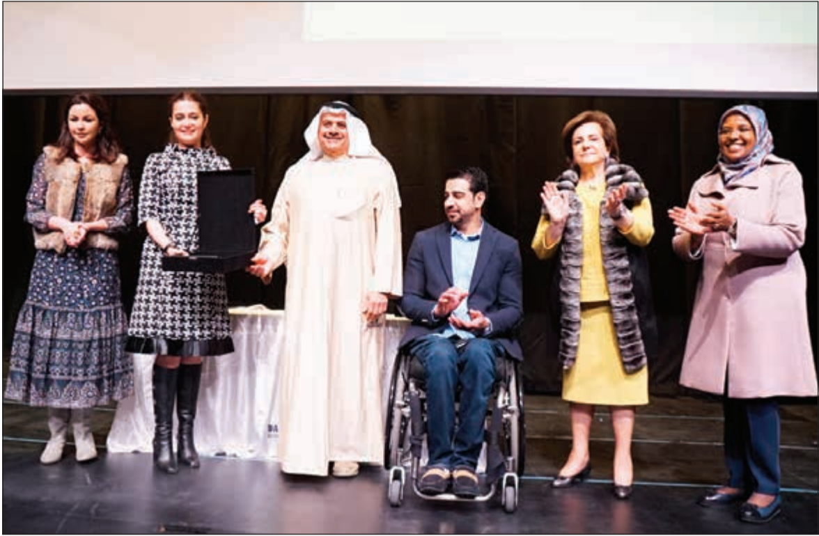
مدرسة دسمان ثنائية اللغة والشيخة الزين الصباح تكerman بنك الكويت الوطني على رعايته لمنتدى الشباب

وقد تخلل المنتدى مشاركات الطلبة الشباب في مناقشات مختلف القضايا الحيوية في الشأن العام وذلك من أجل إثراء خبراتهم وتحفيزهم وتعزيز ثقتهم بأنفسهم وبقدرتهم على النجاح. ويواصل بنك الكويت الوطني سنويا مبادراته الإنسانية ودعمه لبرامج الرعاية الاجتماعية انسجاما مع سياساته الراسخة للنهوض بمسؤولياته الاجتماعية وإيماناً بالأثر الفعال لهذه البرامج في خدمة المجتمع وأبنائه، كما إنها تعكس الدور القيادي الذي يلعبه البنك الوطني في هذا المجال منذ عقود طويلة.