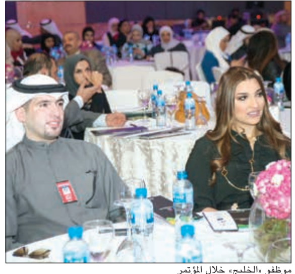
موظفو «الخليج» خلال المؤتمر

أما بالنسبة لورشة العمل التي عقدت لمدة يوم كامل، فقد تناولت مواضيع عديدة منها: دور التعلم المؤسسي في إعداد قادة القطاع الخاص، والتفكير الاستراتيجي في بناء أسس التعلم المؤسسي في الحاضر والمستقبل. وشارك في المؤتمر نخبة من الخبراء والمتخصصين في السوق المحلي لمشاركة نجاحاتهم، وعقدت سلسلة من جلسات النقاش وورشات العمل بهدف الوصول إلى حلول مبتكرة وأفكار جديدة حول التعلم الفعال والتطور المؤسسي.