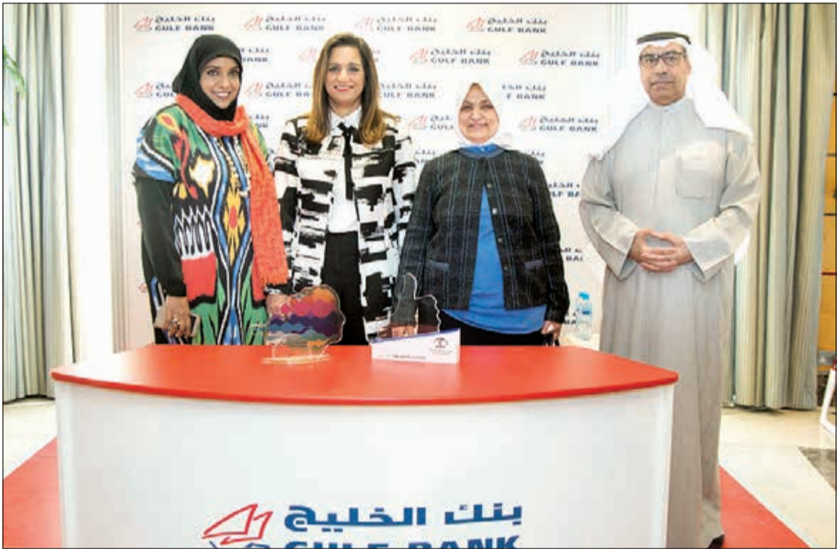
سلمى الحجاج وغوزي المجلي والوزيرة هند الصبيح

المعرفة في المؤسسات، والتعلم، على سبيل المثال لا الحصر». كما شارك في هذه النقاشات متحدثون مختلفون من نواب وأساتذة وكبار الرؤساء التنفيذيين، وخبراء التفكير الاستراتيجي ومؤسسي الأكاديميات، للتحدث عن خبراتهم في بناء فلسفة التعلم المؤسسي السليمة.