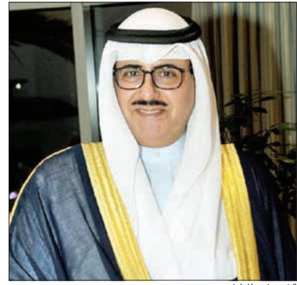
الشيخ فهد المبارك