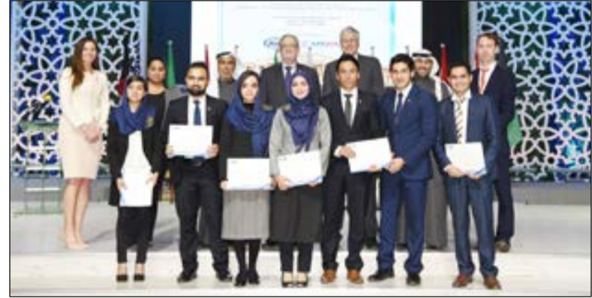
د. المقاطع والسفير الأميركي مع عدد من المكرمين