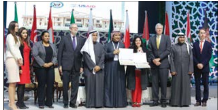
تكريم فريق كلية القانون الكويتية العالمية