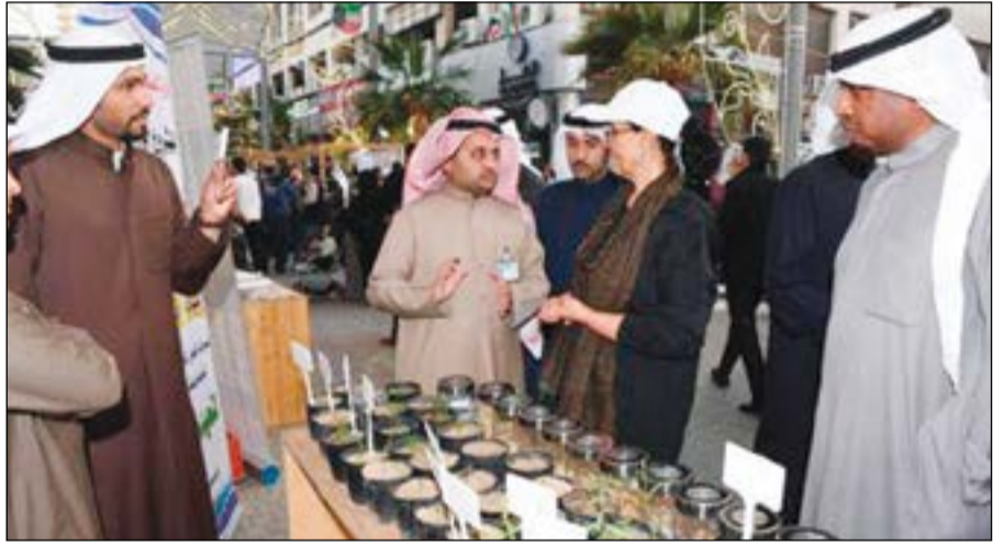
الشيخة أمثال الاحمد تطلع على الشتلات في جناح الهيئة

أكدت الهيئة العامة للتعليم التطبيقي والتدريب أهمية مهرجان «إكسبو الشارع الجديد» في المباركة والذي يقام ضمن مبادرة صاحب السمو الأمير الشيخ صباح الأحمد الخاصة بالمشروع الوطني لاحتضان وتنمية المواهب والمشاريع الشبابية بالمجتمع.